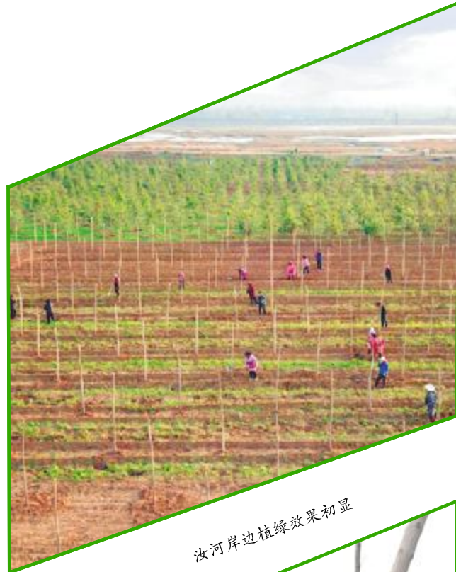
汝河岸边植绿效果初显