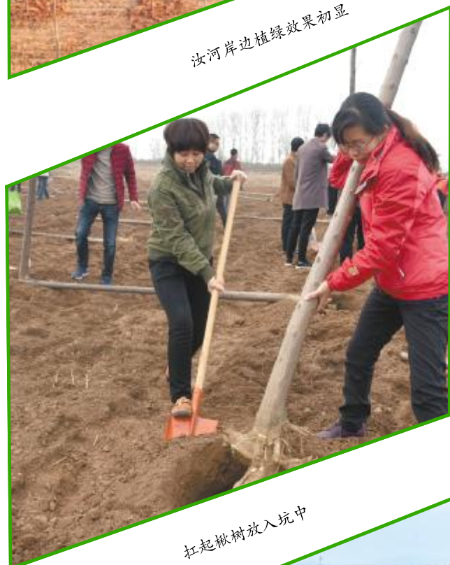
扛起大树放入坑中