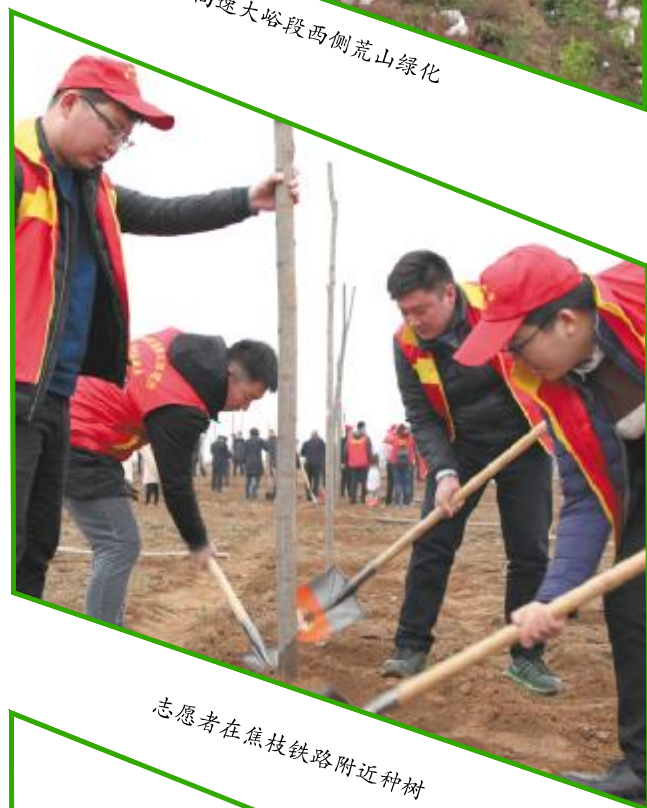
志愿者在焦枝铁路附近种树