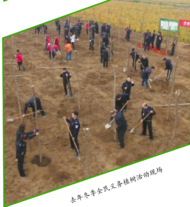
去年冬季全民义务植树活动现场