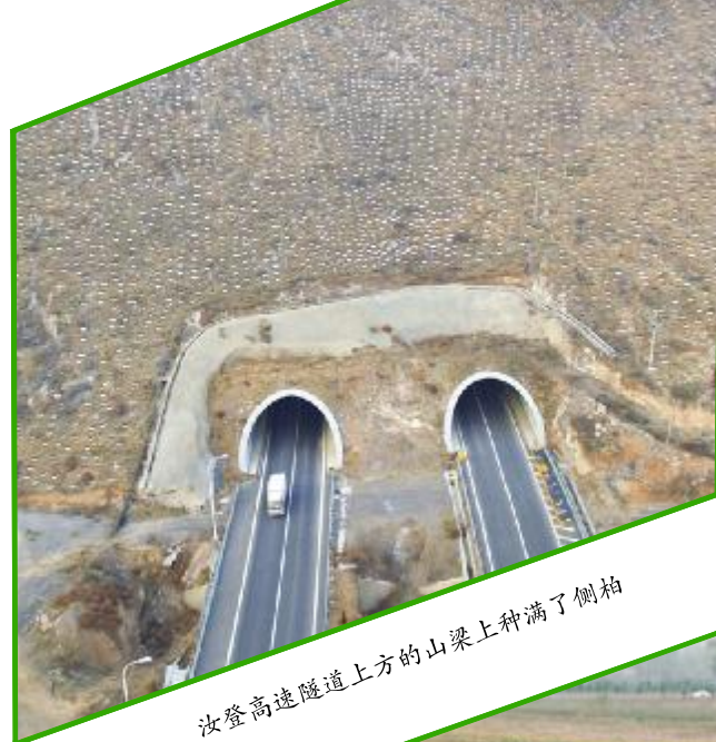
汝登高速隧道上方的山梁上种满了侧柏