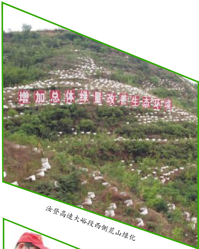
汝登高速大峪段西侧荒山绿化

围绕生态汝州和田园城市建设，先后研究制定了《汝州市林业生态建设实施方案》《汝州市廊道绿化工程质量提升和档案提升方案》《汝州市国储林建设实施方案》等文件，通过实施龙山森林康养特色小镇建设、高速公路和铁路绿化、镇郊森林公园建设、林业产业、河湖库渠绿化、旅游示范线路绿化、生态廊道完善提升、荒山绿化、城区绿化提档升级和生态文化建设等十大绿化工程，在全市范围内掀起了植树造林高潮，有力推动了林业生态建设。