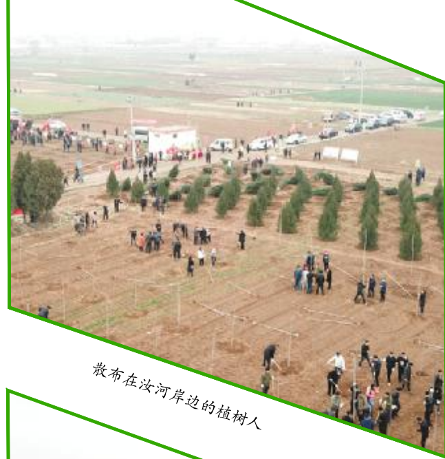
散布在汝河岸边的植树人