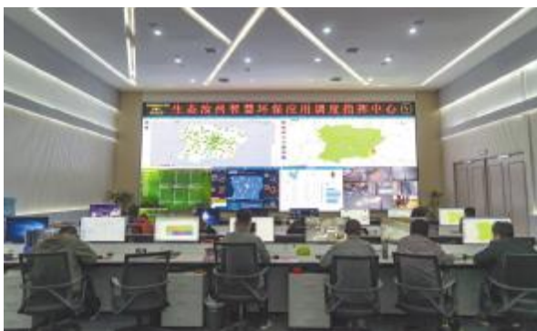
生态汝州智慧环保应用调度指挥中心