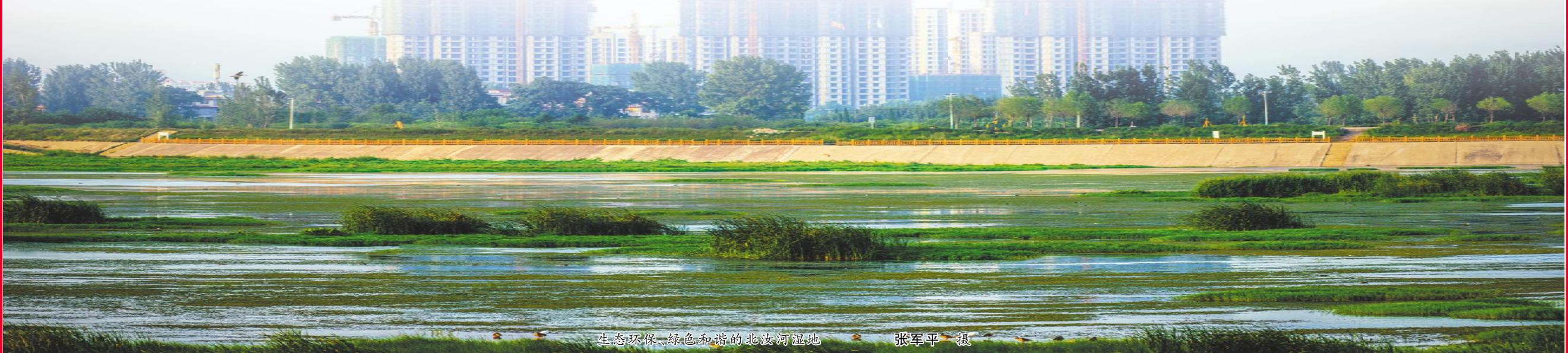
生态环保、绿色和谐的北汝河湿地