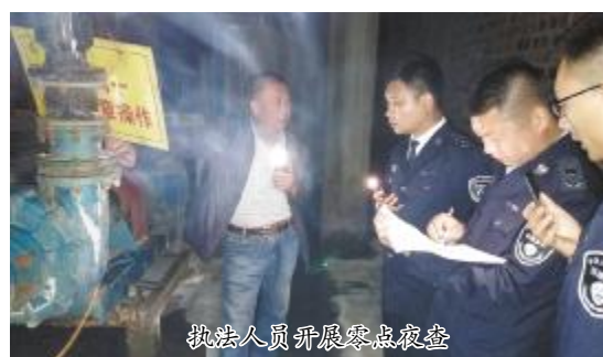
执法人员开展零点夜查

“环保局夜查，把门打开！”今年1月7日22点42分，市环保局督查组在天瑞焦化有限公司光明执法身份后，直奔出现场。察看焦炉出焦情况后，又登上脱硫塔对污染防治设施进行察看，并详细询问了企业限产减排等相关情况。督查组在企业调度室查阅企业生产调度台账及出焦记录，对重污染天气应急管控各个环节措施落实情况进行逐项检查。