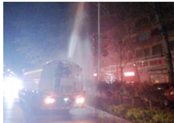
为有效控制柳树、杨树、悬铃木等树木开花时节扬絮的现象，近日夜里，市园林管理中心在物丰街对易发生飞絮的树木喷施絮控药液。