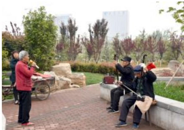
4月13日，有两位老人在广成东路的游园中拉二胡，一位老人伴唱，在生机勃勃的春天里享受闲暇时光。