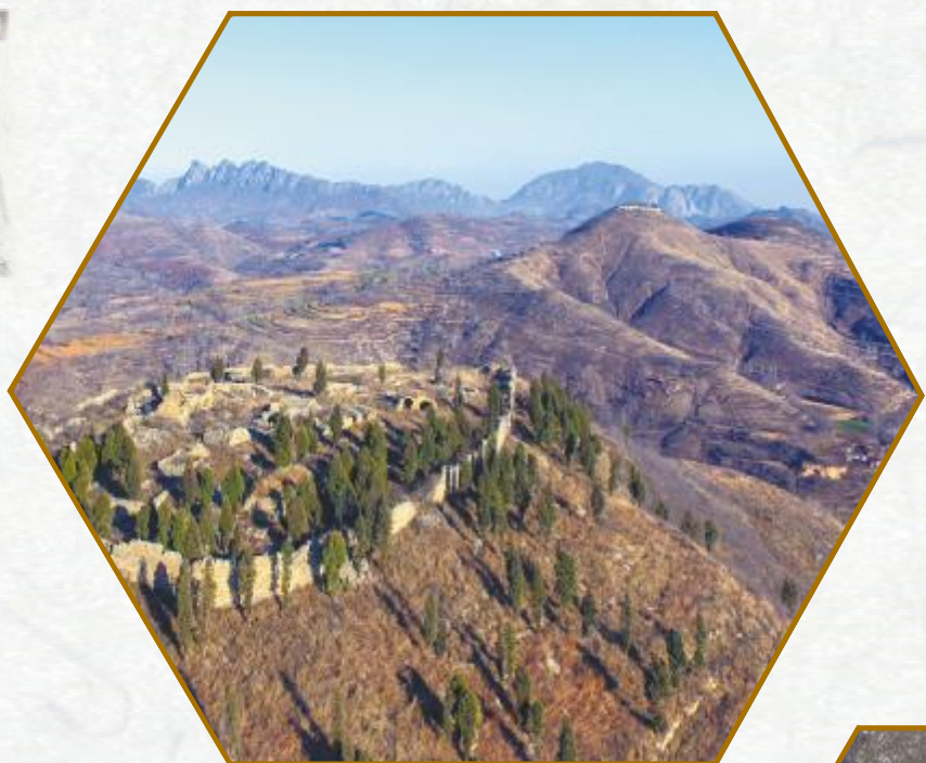
见子岭上见子寨，虎踞河岸傲群峰

在汝州市龙山森林公园景区北部的箕山深处，有一道南北走向的山涧河道青龙河，由四周山梁间诸多汇水沟集水而成。在河道的几个转弯处，自然林木守护着4个石头村落，石窑、石屋、石院、石寨、石堰、石梁、石板路与当地突兀峻拔的峰峦、绵延跌宕的山梁、怪石嶙峋的沟壑相融，楸树、梧桐、木兰、皂角、豹榆等名木古树苍翠，独立的水系哺育出了泉、溪、瀑、塘、潭、河等与水相关的元素。虽有几处抢眼的红砖房，却一点也不影响大自然与人居的和谐。