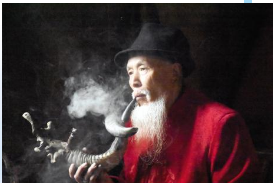
在茶馆中享受时光的老者