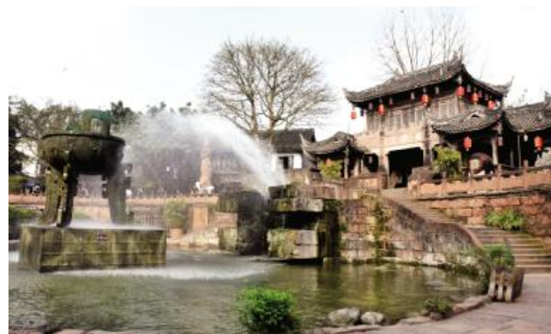
黄龙溪古镇中心喷泉