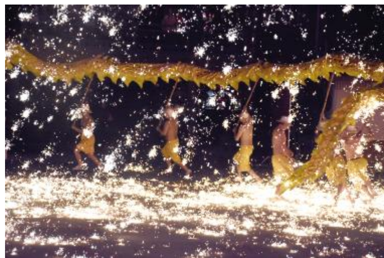
黄龙溪古镇特色节目烧火龙