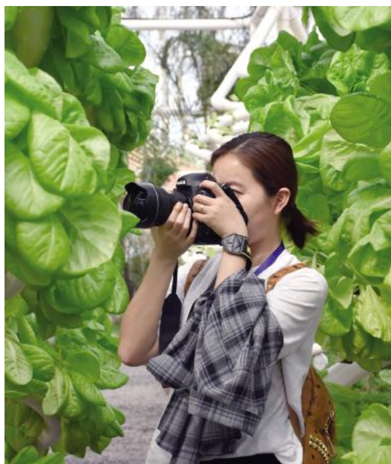
欢乐田园中的螺旋管道蔬菜