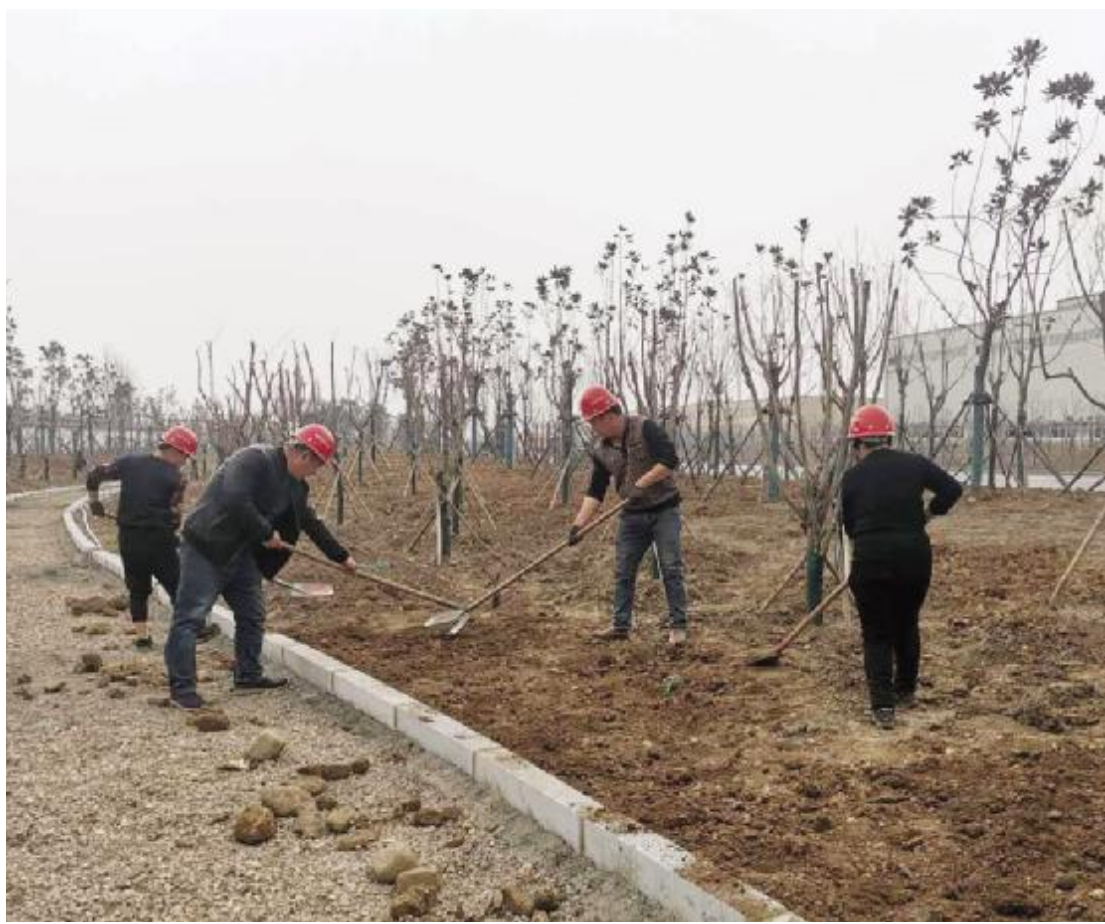
3月10日,我市G207汝河大桥南至机绣园段道路改建工程现场,工作人员正在回填树坑,平整非机动车道路基。

市不动产登记交易中心秉持“让群众少跑腿,让信息多跑腿”的理念,创新服务方式,提升服务水平。申请人足不出户,通过手机、电脑办理不动产登记网上预约、申请、查询等业务,审核后只需到现场确认信息并缴纳相关费用即可。同时,该中心开通了不动产登记便民系统(网上服务大厅)便民服务平台的信息发布功能,可发布不动产登记的政策法规、工作动态及首次登记、注销登记、证书作废、证书遗失、遗赠等需公告的内容,及时准确,方便了群众办事,大幅提高了办证效率。该系统采取人脸识别验证、登记信息脱敏、契约惩罚机制、内外网物理隔离、动态密码验证等9项安全措施,保障公民信息安全,做到不动产登记“便民、高效、公开、透明、安全”。