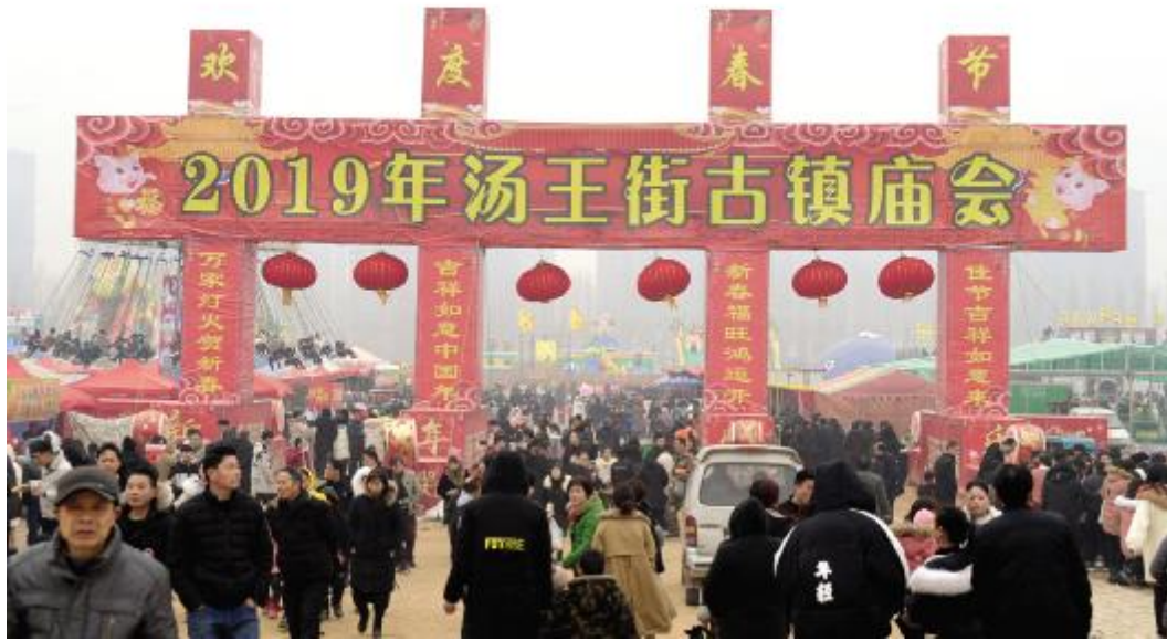
汤王街古镇庙会