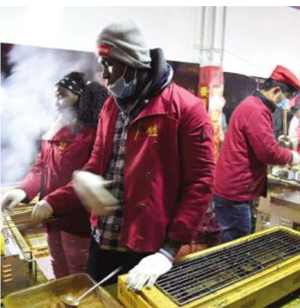
国际友人现身中大街新春庙会卖烤串