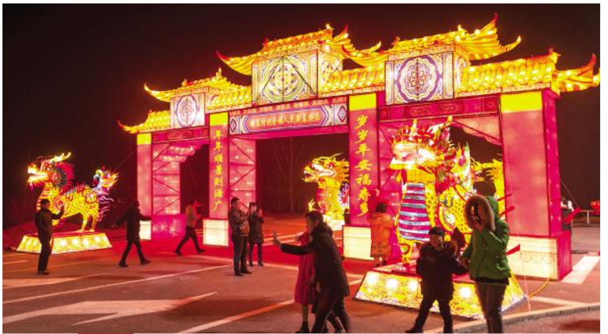
温泉镇灯展吸引群众驻足拍照