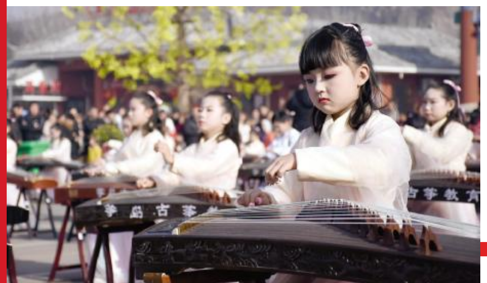
百人古筝表演