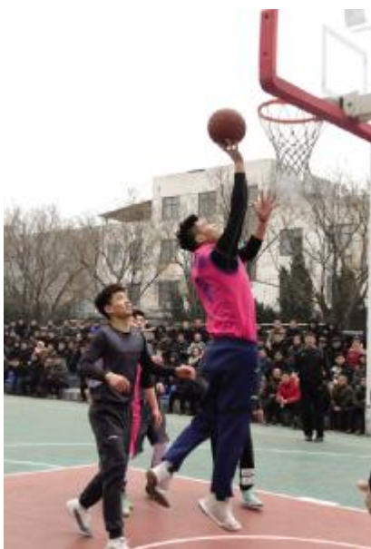
“农商银行杯”大学生篮球赛

农历己亥年春节已过,节日期间,汝州大地年味浓郁,处处洋溢着喜庆的氛围。在各公园、游园、景点,人们载歌载舞,迎接新春佳节的到来。人头攒动的中大街新春庙会、汤王街古镇庙会、颍平花海灯展等,更是吸引着无数群众争相赶年会。放眼整个汝州大地,处处大红灯笼高高挂,各类年俗展示场景布置一新。歌舞升平的盛世佳节,照亮了汝州人民人人团圆,家家团圆的节日情怀。