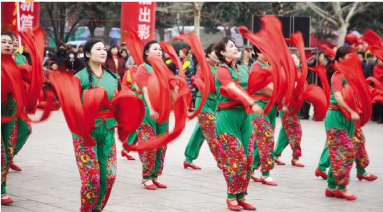
欢乐喜庆的洗耳河街道文艺汇演