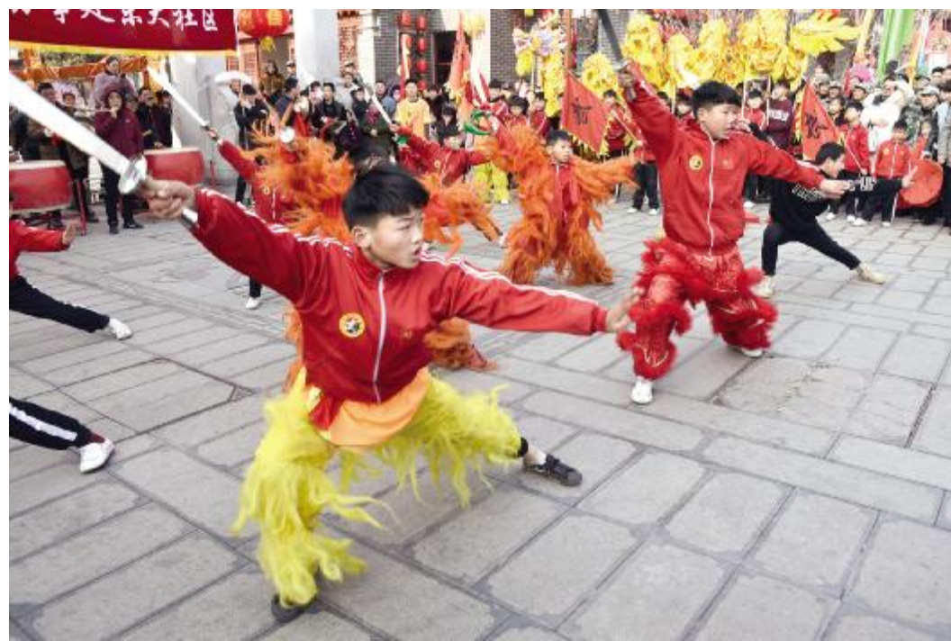
中大街新春庙会武术表演