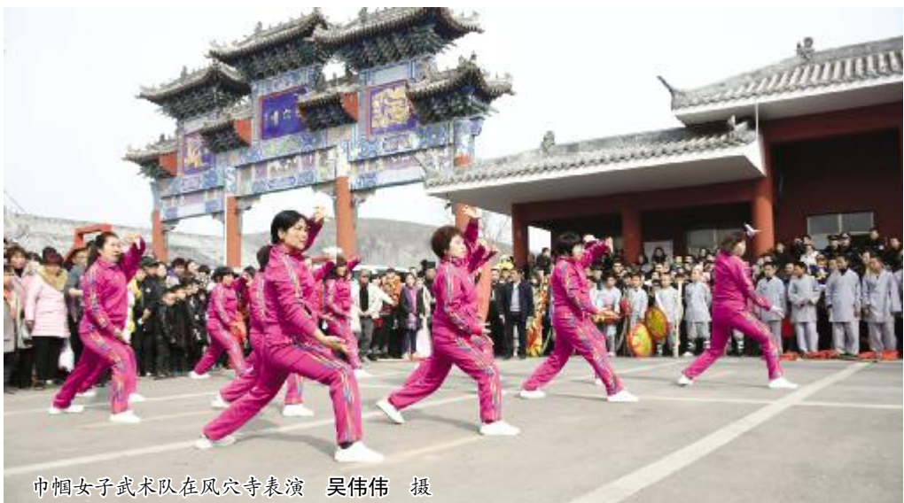
巾帼女子武术队在风穴寺表演