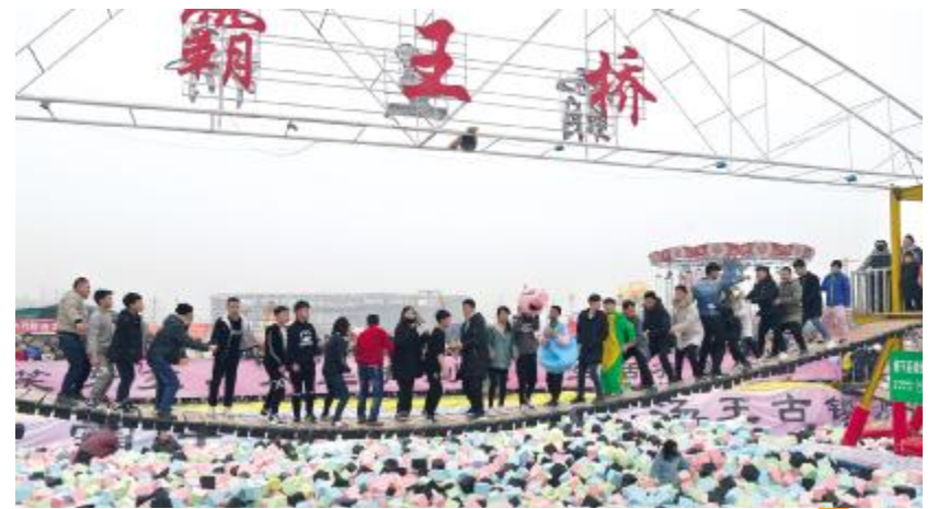
红红火火的温泉镇霸王桥