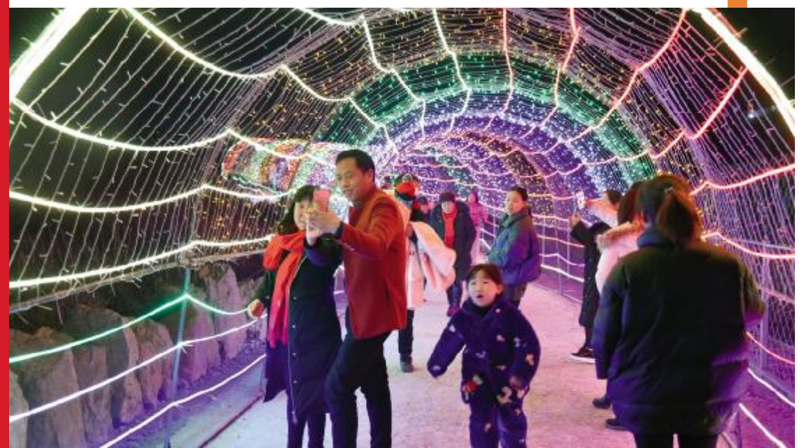
颍平花海灯展