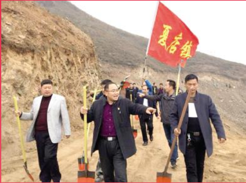
夏店镇党委书记、镇长带队开展冬季植树造林