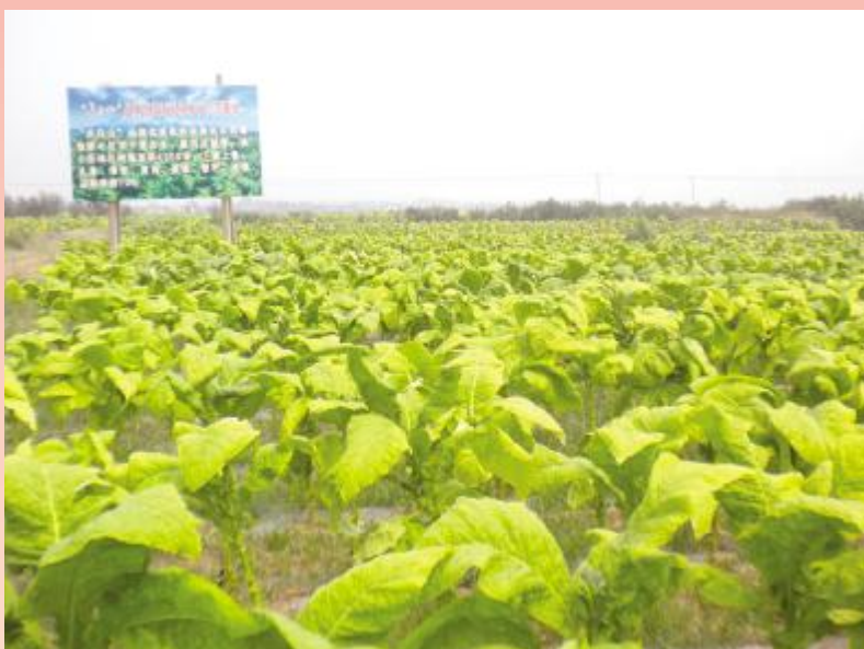
夏店镇金黄的烟叶