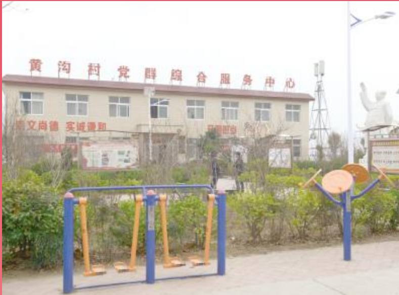
黄沟村美丽的村室和游园建设