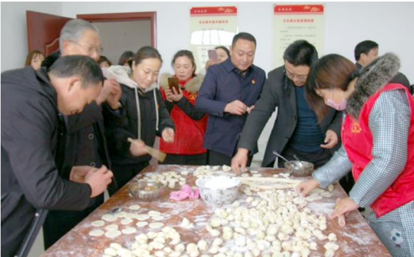
志愿服务队为老人包饺子

本报讯（融媒体中心记者 刘培培）1月14日，汝南街道粪堆赵村创建“汝州市孝善第一村”活动启动，来自该村的180名70岁以上老人吃到了由村里志愿服务队的热气腾腾的饺子，喝到了鲜牛奶，好媳妇代表也宣誓要敬老爱老，现场暖意融融。