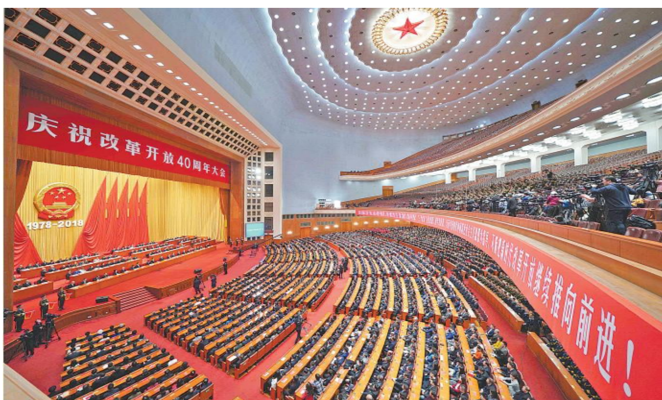
12月18日，庆祝改革开放40周年大会在北京人民大会堂隆重举行。