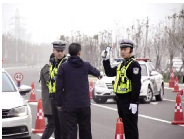
交警亮明身份