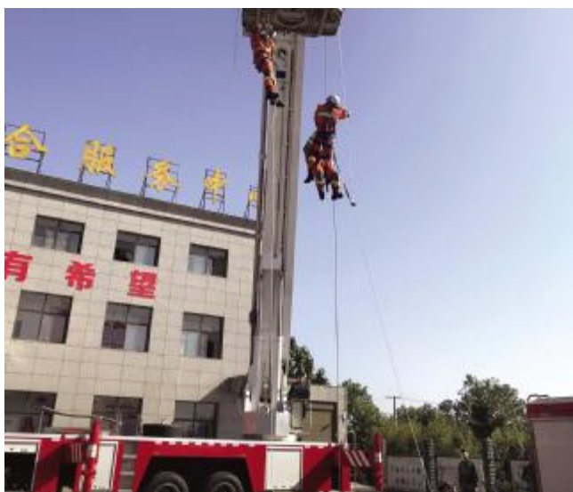
演示携带救援物资