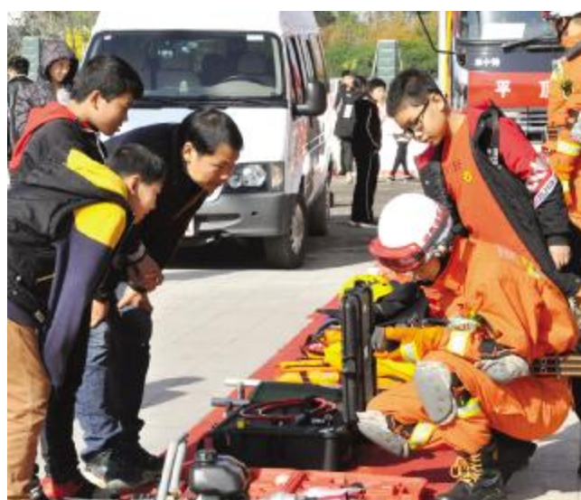
讲解器材使用方法