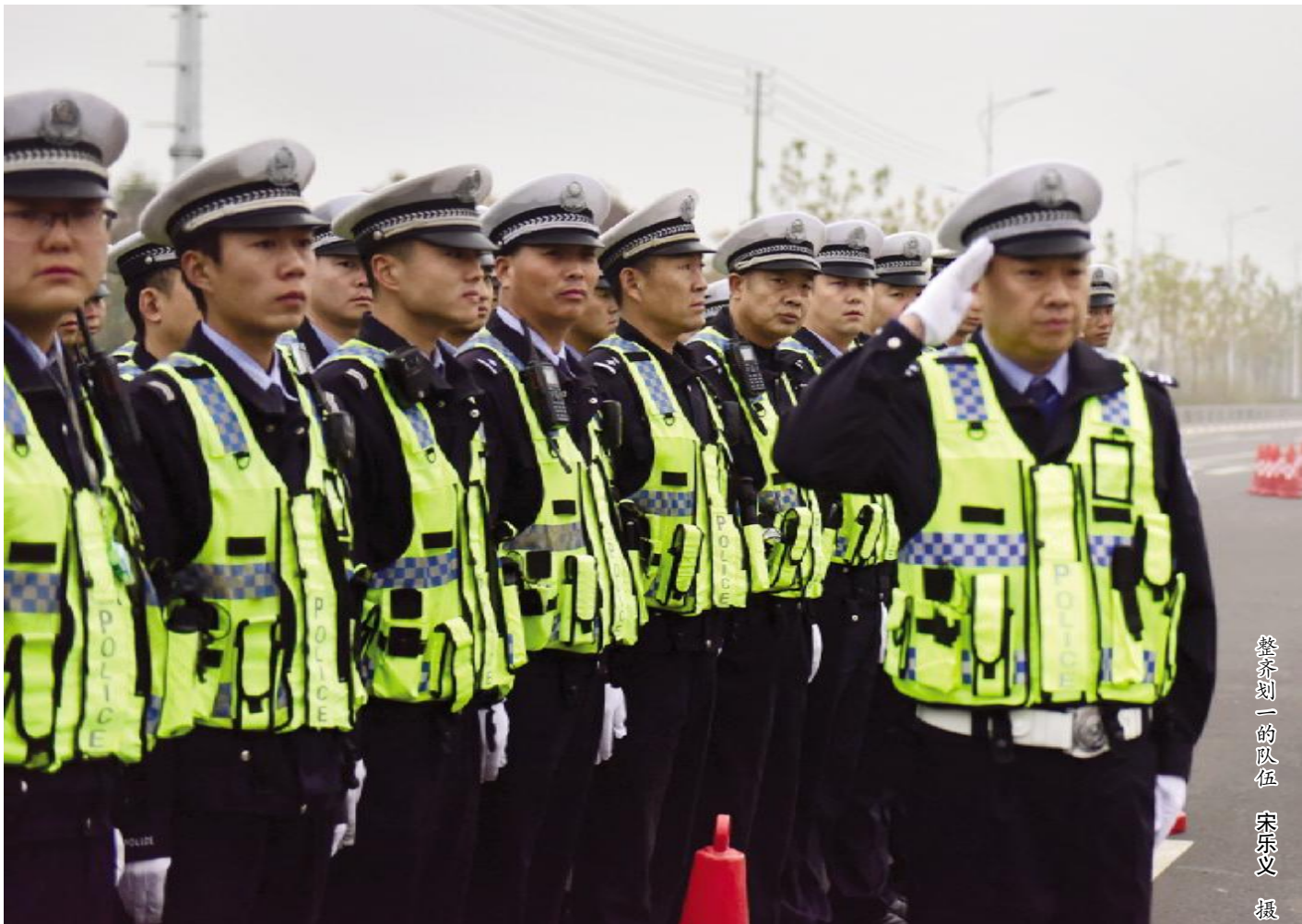
整齐划一的队伍