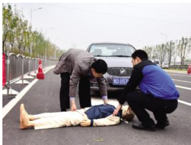
模拟救援