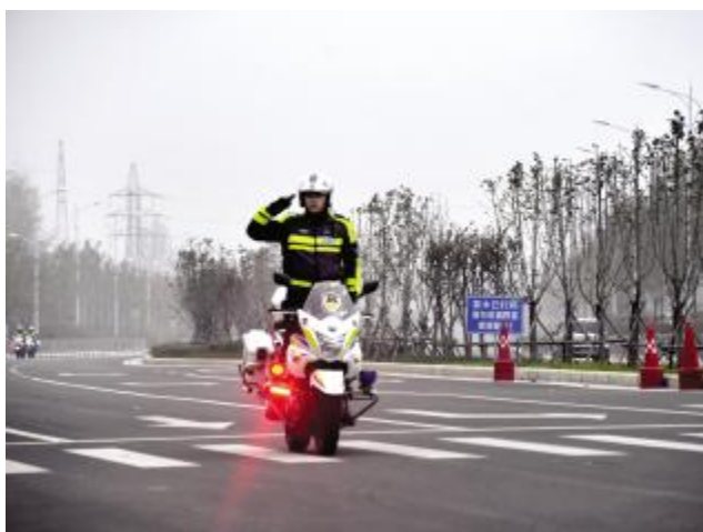
英姿飒爽的骑警

记者在现场看到，实战演练阵容强大，队伍整齐划一，大家对演练科目能做到操作规范、文明细致。现场参训的民警不仅刻苦钻研技能，还对细节反复打磨，逐步整改自身存在的问题和不足，使实战能力得到迅速提高，以实际行动体现了“以战代训、以训促战、战训合一”的目标，为更好地开展道路交通管理工作打下了坚实的基础。