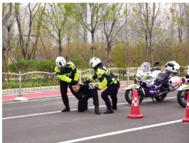
模拟制伏歹徒