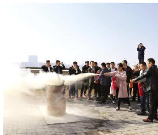
住建局开展消防演练