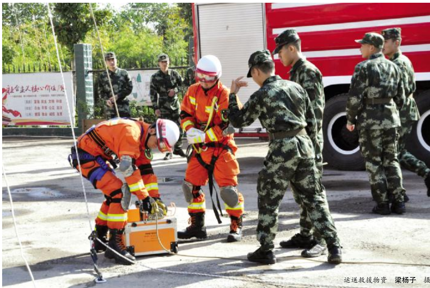
运送救援物资

当天，全市各单位积极响应此次“119消防宣传月”活动，焦村镇以“全民参与防治火灾”为主题，开展消防宣传活动，在全镇营造全民参与消防的浓厚氛围。市住建局组织局机关、部分二级单位、建投大厦物业等开展消防演练。市产业集聚区污水处理厂开展“人人争当消防队员”活动，通过现场演练等方式，提高职工消防安全意识和技能。煤山公园和丹阳公园联合在丹阳公园内进行秋冬消防演练。