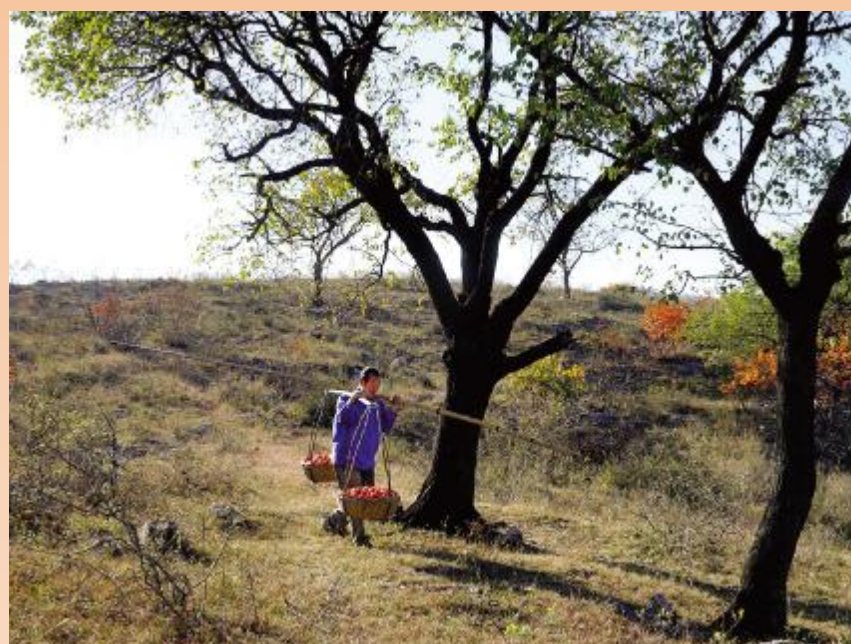
回家的果农