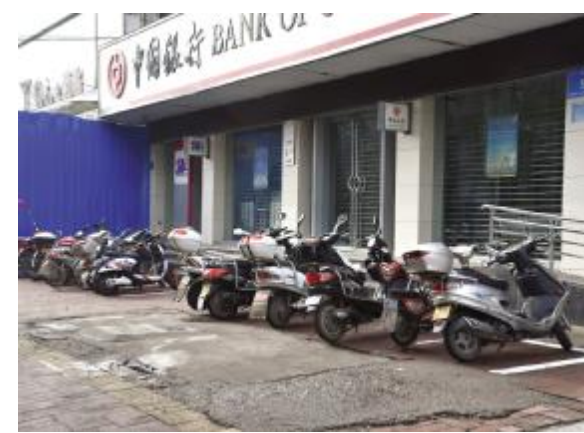
施划的非机动车停车位