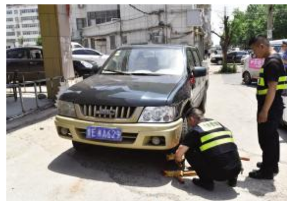
开展私家车占位治理专项行动