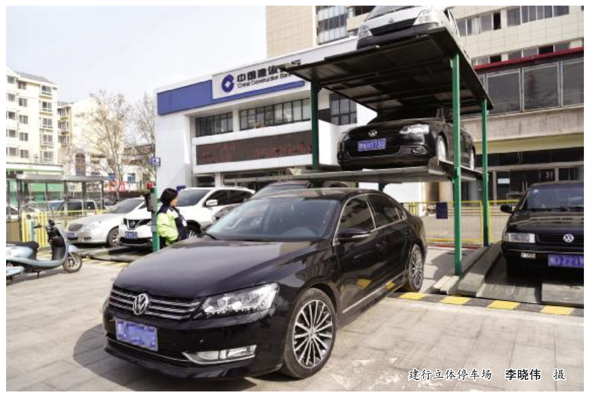
建行立体停车场