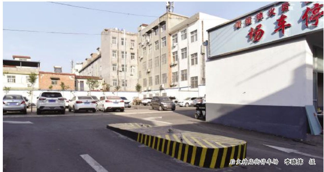
后火神庙街停车场

仅2018年市区新施划的机动车停车位就有3875个,通过大量施划有停放指示箭头的停车位,既解决了机动车无序停放的问题,又最大限度满足了车主停放需求。