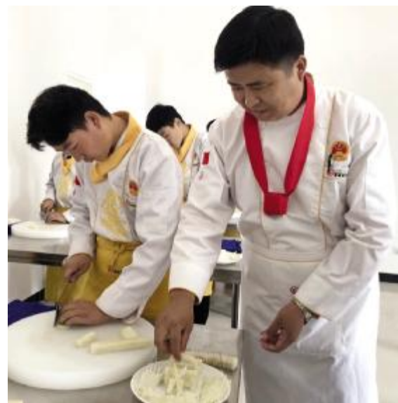
厨师班老师指导学生练习刀功

特色，是一个亮点，是一个品牌，也是一种荣耀。市中等专业学校在这样的硬件设施下，积极创新人才培养模式，推动产教融合、校企合作、工学结合、知行合一的办学育人模式，实现产、教、学、研为一体的办学目的，不仅培养出了一批具有一技之长的优秀职业技能学生，为更多的企业输送高质量的技能人才，更通过特色教育，彰显出越来越独特的职教魅力。