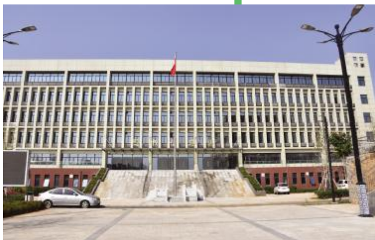
图书信息楼