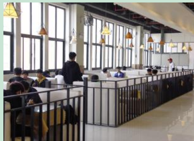
餐厅一角