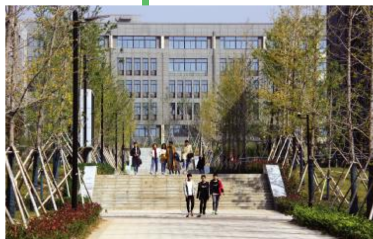
走在校园的学生