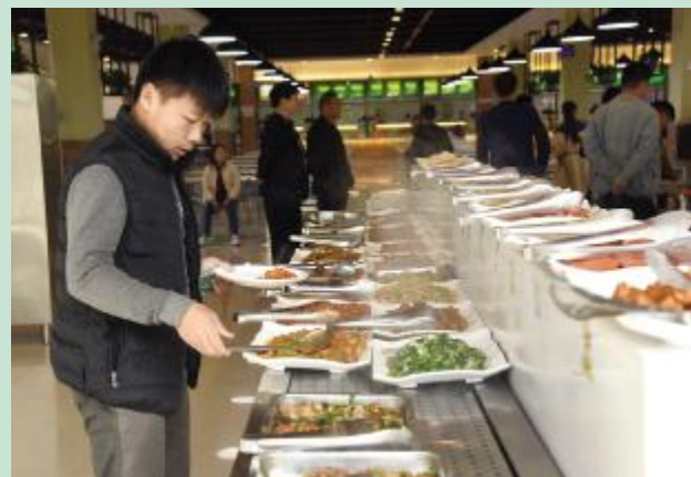
学生正在就餐

市中等专业学校是国家级重点学校，教育部先进单位，在2017年被河南省教育厅命名为河南省职业教育特色校、畜牧养殖专业获得河南省特色专业称号。现有普通中专学生2400余人、成人中专班学员4500余人，教职工148人，其中高级职称27人、中级职称54人，省优秀教师8人、省教学名师4名、省优质课教师22名、双师型教师58名。为适应市场发展，学校的拳头专业由农业技术转变为适合市场发展趋势的多元化现代专业，并在不断创新办学模式的进程中，走出了一条全新的特色职业教育发展之路。