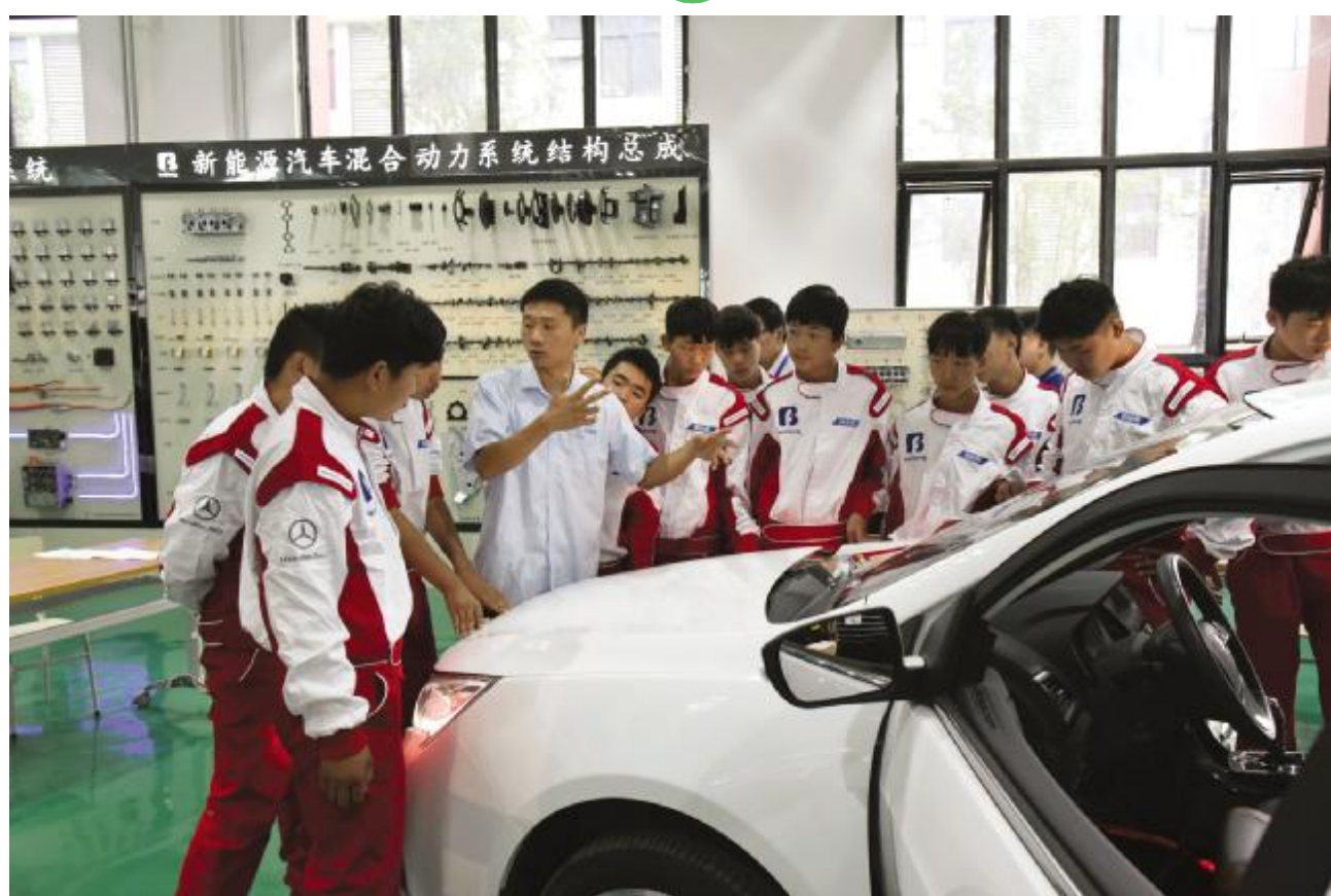
汽修班老师正在为学生们上课