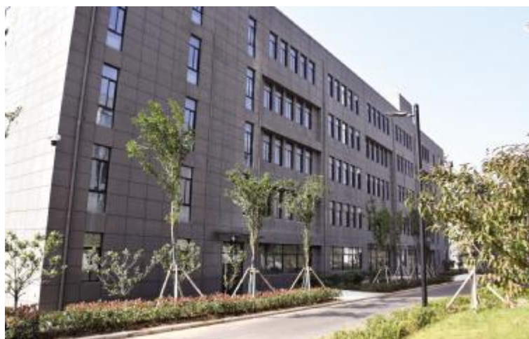
校园一角