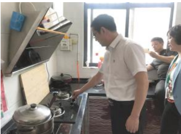
天然气通进群众家中