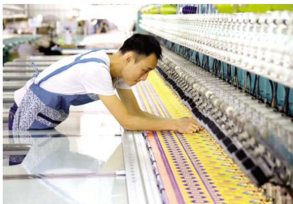
汝绣产业园投产，众多农民工实现在家门口就业的梦想