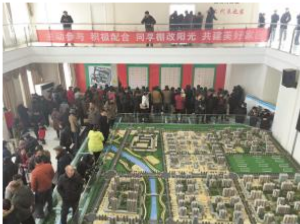
南关居民喜选回迁房

一张张灿烂的笑脸，洋溢着对美好生活的向往；一幅幅美好的画面，展现着和谐宜居之城的别样美好。伴随着生态智慧健康文明幸福区域性副中心城市建设号角的吹响，和谐宜居的新汝州，必将为我们带来别样美好的幸福新生活。（本版图片均为信息中心资料图）