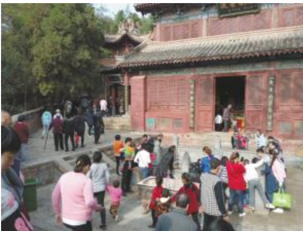
风穴寺免票后游人如织