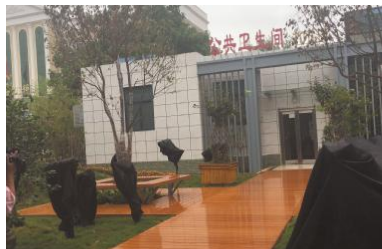
环境优美的免费公厕