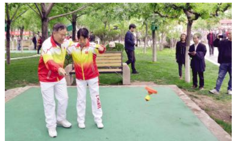
城区新建、扩建众多公园、游园，为市民休闲健身提供好去处