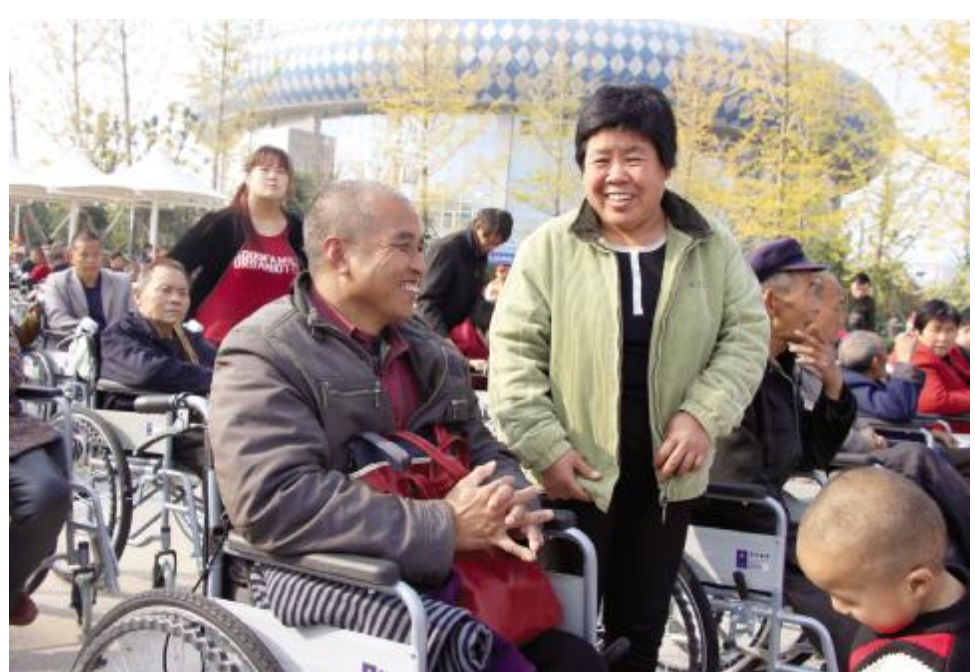
贫困户收到免费发放的助听器，脸上笑开了花