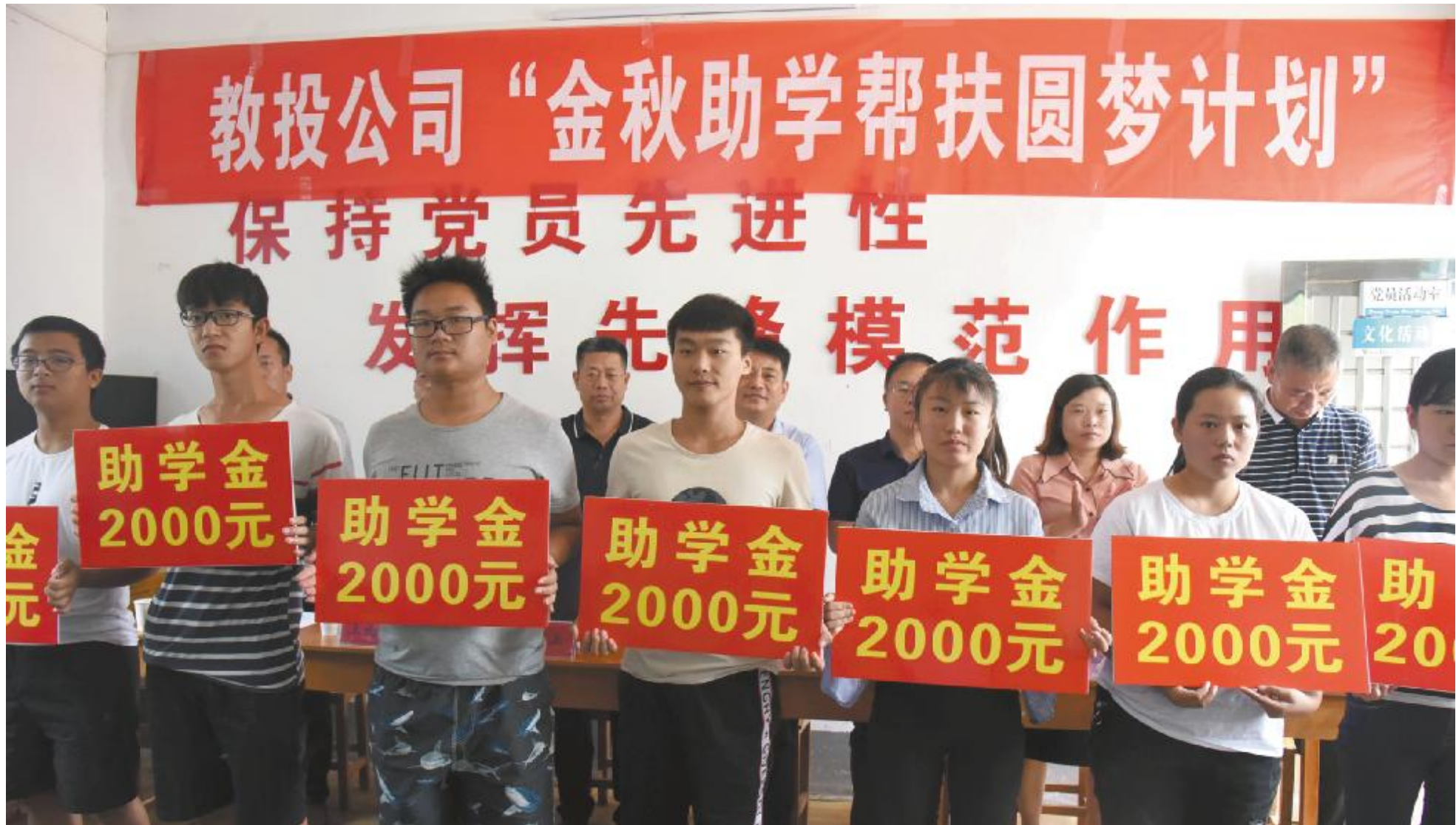
金秋助学帮扶困难学子圆大学梦