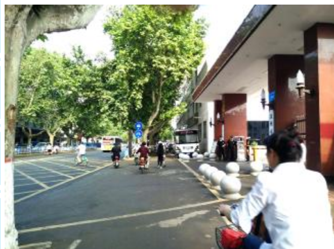
市政府门前(改造后)

理、两手发力”的指导思想，对海绵城市进行了一系列顶层设计，按照“源头削减、过程控制、系统治理”的思路，同时学习借鉴国内外海绵城市先进建设经验，提出了生态水系、排水防涝、污染防控、园林绿地、道路交通、海绵社区六大体系的建设布局。坚持“道法自然”的海绵城市建设理念，逐步探索海绵城市建设管理新模式，走出具有汝州特色的海绵城市建设之路。