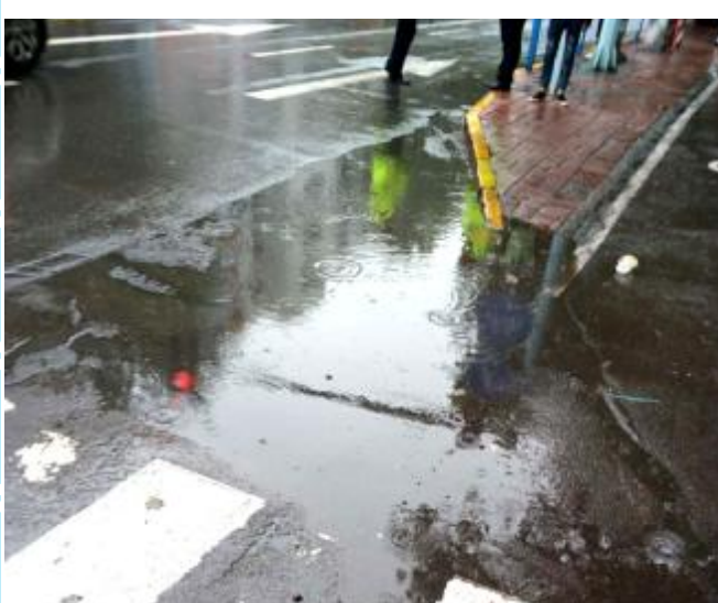
市政府门前(改造前)

海绵城市建设是我市“打造生态汝州、建设山水宜居绿城”的重要载体。在建设过程中，我市始终坚持“认识到位、领导到位、规划到位、示范到位、建设到位、宣传到位”的“六到位”原则，遵循“节水优先、空间均衡、系统治