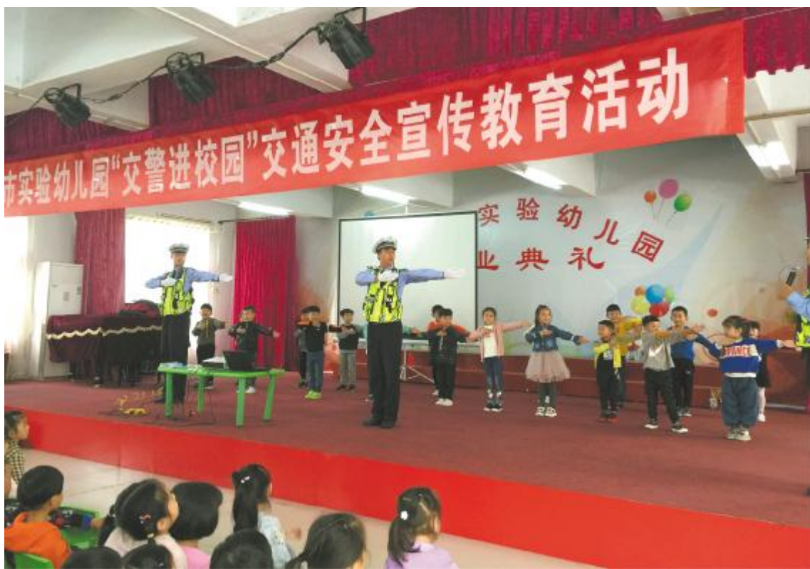
小朋友们跟交警一起学习交通手势

据了解,今年以来,实验幼儿园已开展了多次安全教育活动,从道路安全、防火安全、自救等多方面入手,引导孩子们树立安全意识和自我保护意识。