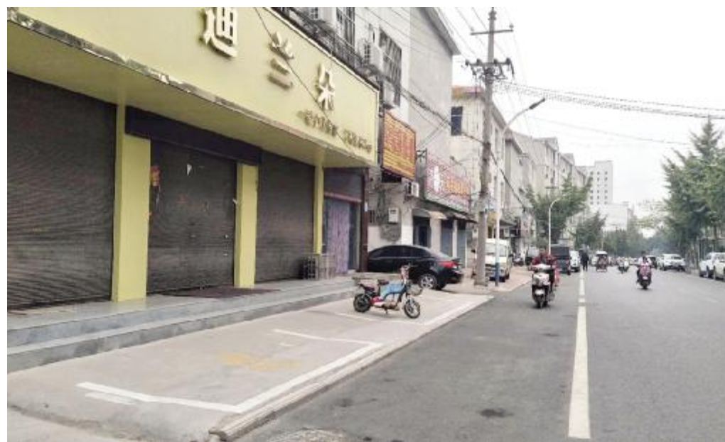
建兴街中段长距离没有栽种绿化树。