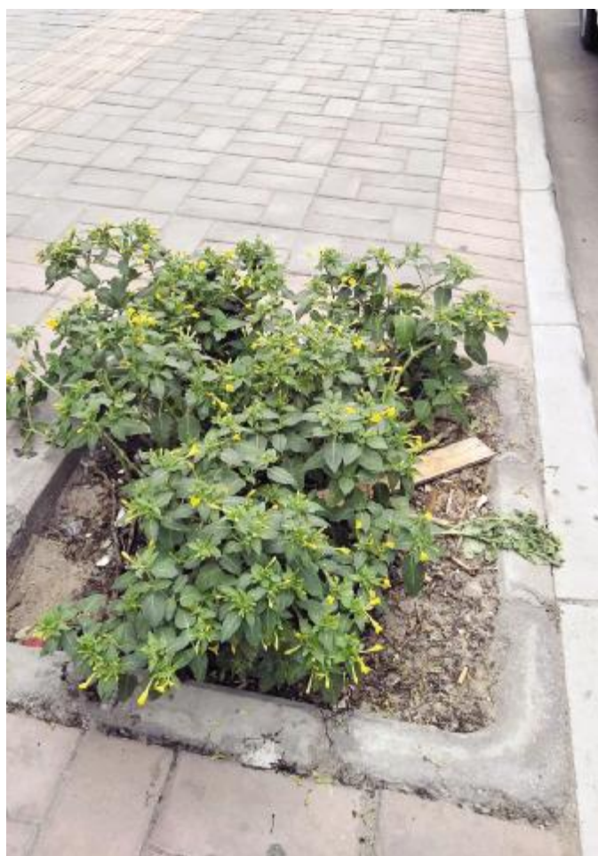
永安街北段一个树坑已被人种上了花。