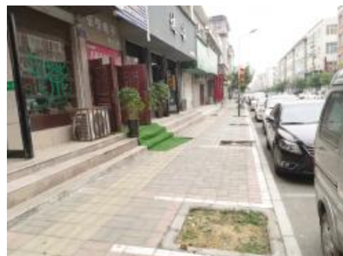
永安街北段遗留多个树坑。

前不久,本报曝光市区3棵合欢树惨遭“剥皮”后,引发社会强烈反响,作案者虽被绳之以法,但本报仍不断接到群众反映,不仅仅这3棵惨遭厄运,在我市不少街道,还有许多行道树无故消失,有的甚至连树坑都被覆盖。