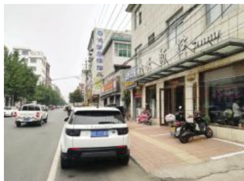
建兴街中段将近100米的距离没有栽种绿化树。