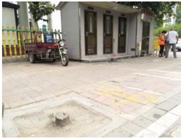
建兴街南段公共卫生间门前孤零零的树桩。