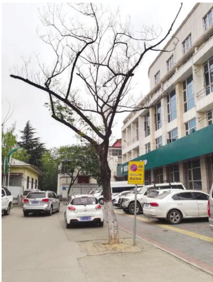
国家电网汝州供电公司缴费大厅门前枯萎的合欢树。