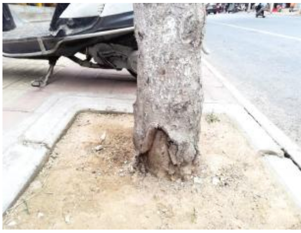
建兴街一棵绿化树根部有损害痕迹。