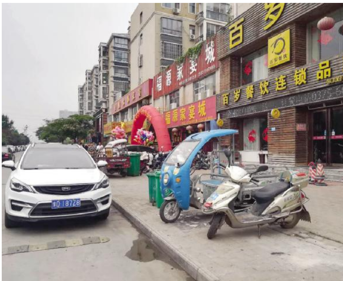
洗耳河东岸百岁鱼饭店向北近50米路段绿化树无故消失。