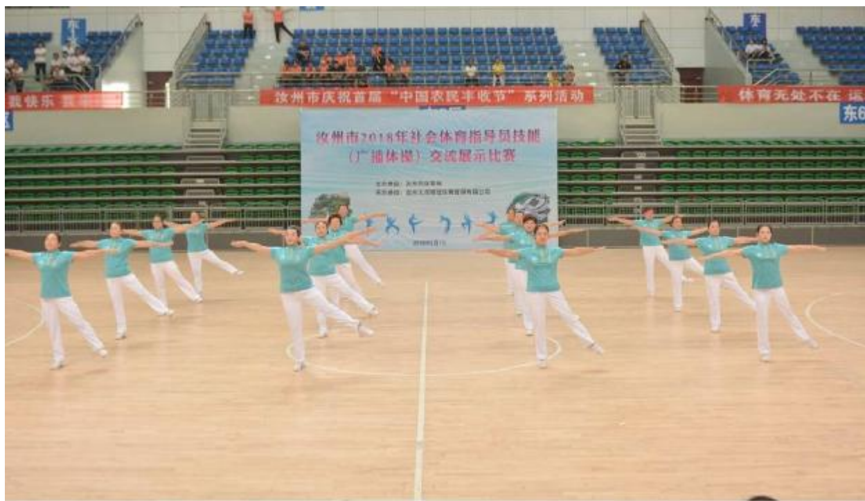
9月7日,来自全市乡镇(街道)、市直委局的35支代表队在市体育文化中心参加我市第九套广播体操比赛。各参赛队伍向大家展示了朝气蓬勃、积极向上的精神面貌。

此次通过与村民一起合作编制村庄规划,实现了乡村建设发展有目标、重要建设项目有安排、生态环境有管控、自然景观和文化遗产有保护、农村人居环境改善有措施的目标。