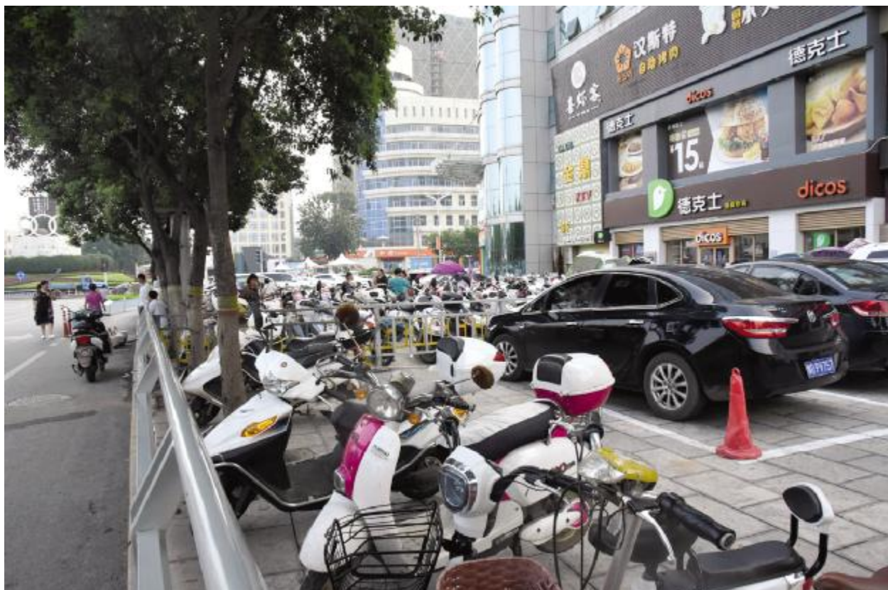
金鼎时代广场路段商家圈划的停车场占据人行道和盲道。

无障碍,是残疾人最具体最现实的诉求之一,是他们走出家门参与社会生活的必要条件。残疾人与正常人享有平等的权利,无障碍设施是他们能够实现这一权益的必要方式。当这些设施遭到破坏时,就等于变相剥夺了他们的权益。已建设好的盲道因管护不力而派不上用场,也是一种资源浪费。