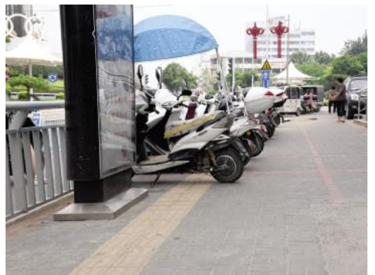
市标农商银行门口20余辆电动车占用盲道。

家人的担心是有原因的,之前邵彦涛曾有过一个人出门的经历,尝尽了盲道“不给力”的苦头。“你就这样走着走着,谁也没碍着,没准一头就撞到了车子上,尽管万分小心,有一次还是被八团路口盲道上的车子蹭破了皮。路上有太多不安全因素,所以渐渐地没有家人陪着我也就不敢出门了。”