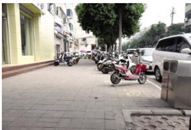
将台街未设置盲道。