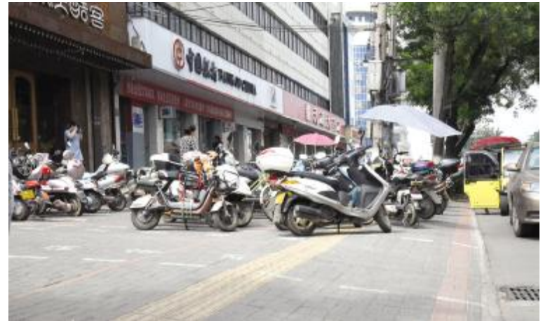
广成路市第一人民医院西侧近百米盲道被占。