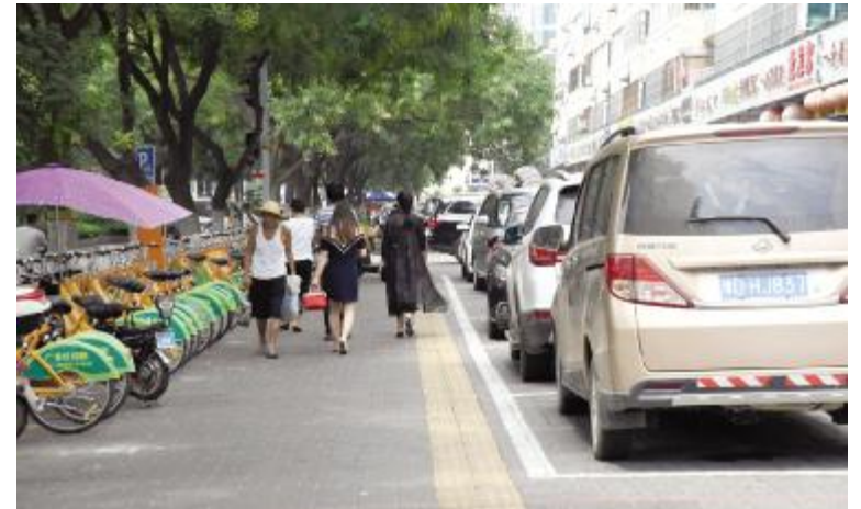
广成路上盲道与机动车位过近。