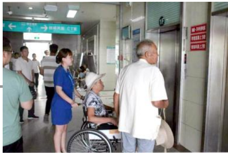
推轮椅接送行动不便的患者