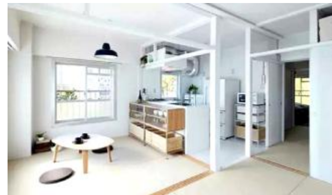
开放式厨房

买了新房得好好装修一下，有人想更好地布局厨房空间，索性把厨房门拆掉，厨房与客厅相连看起来更舒服。但洛阳新奥燃气有限公司的工作人员告诫朋友们：开放式厨房看起来很时尚，但这不符合天然气标准。