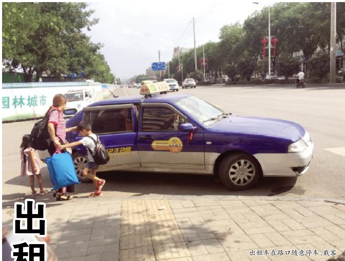
出租车在路口随意停车、载客