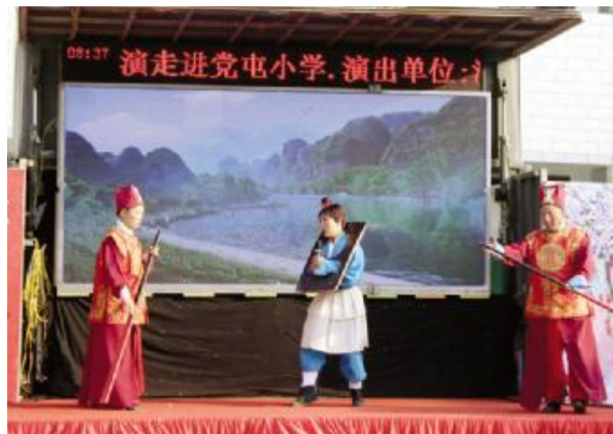
送戏进校园活动走进党屯小学

传播正能量、歌颂爱国主义、彰显民族精神、展汝瓷大美、秀曲剧柔美”的原创大戏,获得河南省第十四届戏剧大赛河南文华奖,并参与了河南省纪念改革开放40周年文艺展演活动。市第一曲剧团排演的《天下父母》于2018年6月赴京进行汇报演出。30年来,作为戏曲教育创作主要基地的市文化艺术学校,为高一级文艺演出团体或艺术专业学校培养和输送了大批艺术人才,编排的《朝阳沟》《拷红》《花木兰》《泪洒相思地》《五世请缨》等折子戏多次参加市里组织的法制宣传、安全生产等文艺演出及汝州电视台《艺苑春》等电视戏曲栏目。