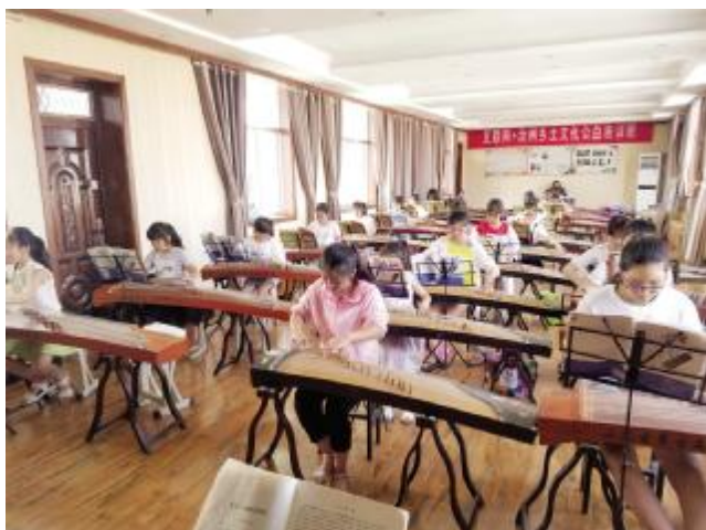
市群艺馆2018年教你一招公益古筝培训