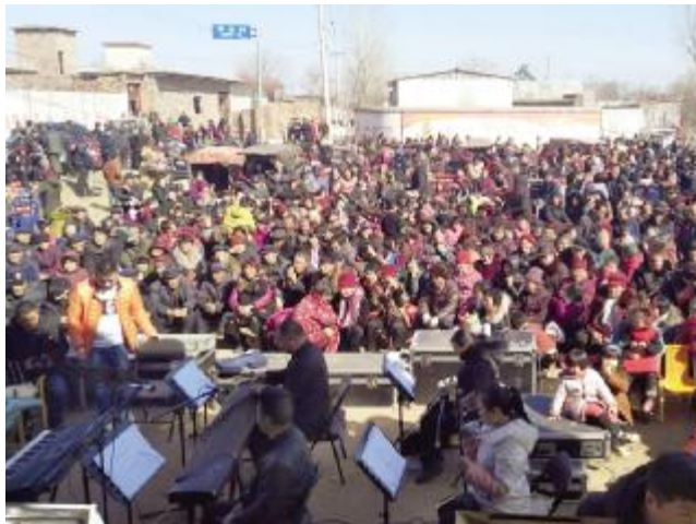
市曲剧团送戏下乡活动