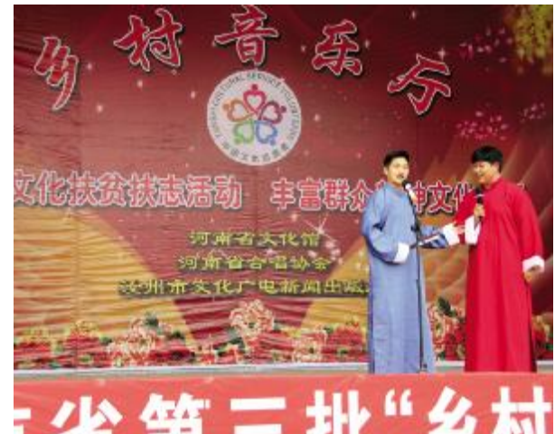
河南省乡村音乐厅活动走进庙下镇乐寨村