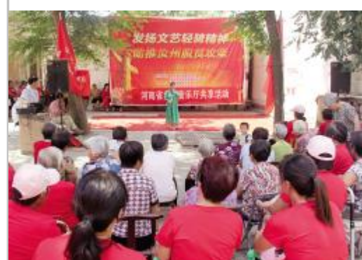
文艺轻骑兵助力脱贫攻坚

1998年以来,我市积极组织市心连心艺术团送文化下乡演出、庆祝人大成立50周年和《宪法》颁布50周年文艺晚会、迎国庆歌咏大赛等重大文艺宣传活动。2004年以来,我市连续多年举办了“快乐周末”消夏晚会、“欢乐中原·魅力汝州”、“百城万场”系列广场文化活动,由全州市直单位、乡镇、办事处和社会团体组织承办,举办单位自编自演的文艺节目,通过丰富多彩的文化娱乐活动和群众喜闻乐见的文艺形式,为人民群众打造了一个又一个赏心悦目的新看点。2015年,我市举办“酒祖杜康·舞动汝州”广场舞大赛,120支代表队参加比赛,掀起了人人热爱广场舞的全民健身热潮。2016年,在火车站广场举办“春满中原”春节广场舞大赛,不仅为我市的舞蹈爱好者提供了一个很好的展示平台,也大大丰富了人民群众的节日文化生活,展现了广大群众积极向上、热爱生活的精神面貌。