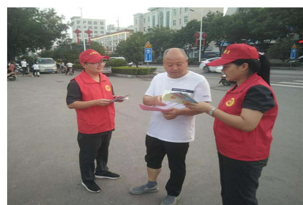
8月6日,市人民法院汝西法庭、交通法庭全体志愿者在煤山公园开展法制宣传志愿服务活动。活动现场,志愿者为市民发放《行人安全过马路的五条原则》《道路交通安全法十防》等安全文明出行提示系列宣传单 700 余份,耐心向市民讲解交通安全法律知识,呼吁市民遇事时要运用法律武器维护自身利益。同时,接受市民法律咨询 100 余人次,获得了市民的好评。

林业局推进志愿服务常态化 本报讯 (记者 于俊鸽 通讯员 陈会芹) 今年以来,市林业局大力弘扬“奉献、友爱、互助、进步”的志愿服务精神,主动适应时代发展,借助创文有利契机,以推进志愿服务常态化为工作思路,深入开展以扶贫济困、宣扬社会主义核心价值观、环境保护、植绿护绿等为主要内容的志愿服务工作,得到了社会的一致好评。 该局成立了由党组书记任组长的志愿服务领导小组,在“志愿河南”网站上成功注册了志愿团体,并组织 120 余名干部职工在该网站注册为志愿者,成立了 6 支志愿服务队。严格按照“六有一落实”的标准要求,建立“文明使者志愿服务站”,同时还出台了《志愿服务活动管理制度》等一系列规章制度,建立了“志愿服务台账”。利用“党员活动日”“德治大讲堂”“读书学习交流”等开展志愿者精神、志愿者章程学习,积极鼓励全局志愿者参加我市其他大型志愿服务活动。运用林业局官方网站、微信、QQ、微博、美篇等新媒体手段大力宣扬志愿服务精神,宣传优秀志愿者事迹和志愿服务活动,提高了干部职工对于志愿服务工作的思想认识和重视程度,在全局形成了人人关心志愿活动,人人参与志愿活动的良好局面。将志愿服务活动与特殊节日、部门职能以及创文相结合,深入开展了“党员下乡慰问”“义务植树”“送法进乡村”“清洁城市”“文明旅游”“扶贫帮困”等一系列志愿服务活动。今年以来,该局共开展各类志愿服务活动 50 余场次,参与志愿者达 600 余人次。