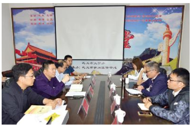
在巩义市新闻宣传中心开展座谈。