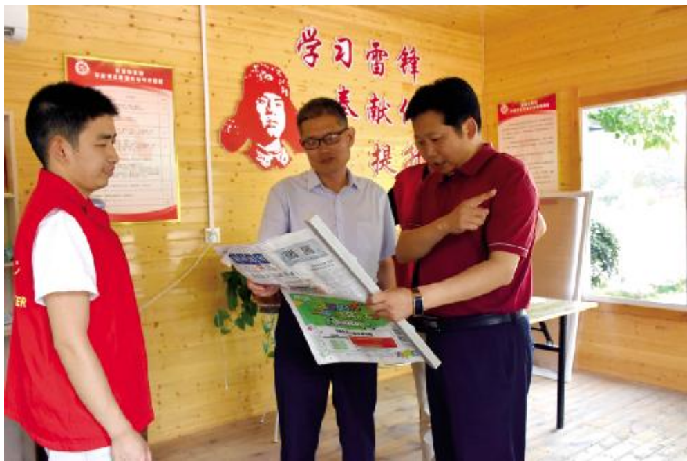
在长垣县志愿者服务站参观学习。