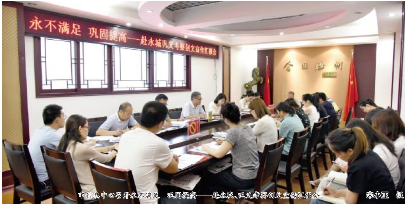
市信息中心召开永不满一巩固提高——赴永城、巩义考察创文宣传汇报会。