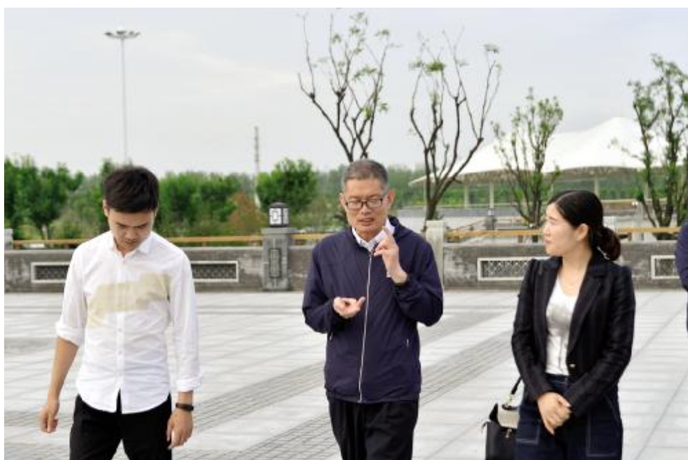
在永城市参观城市建设。