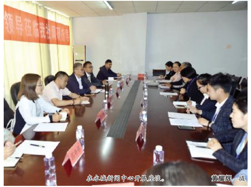
在永城新闻中心开展座谈。