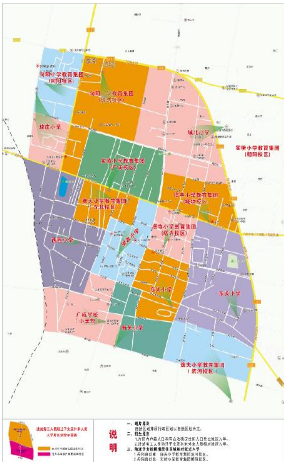
汝州市城区公办初中(部分)2018年招生区划示意图