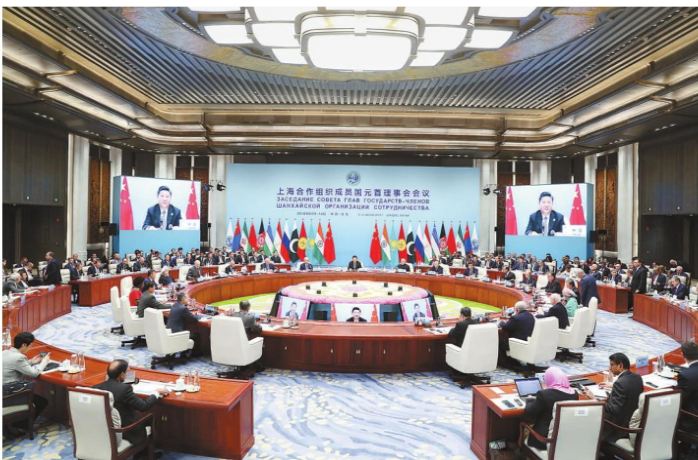
6月10日,上海合作组织成员国元首理事会第十八次会议在青岛国际会议中心举行。国家主席习近平主持会议并发表重要讲话。