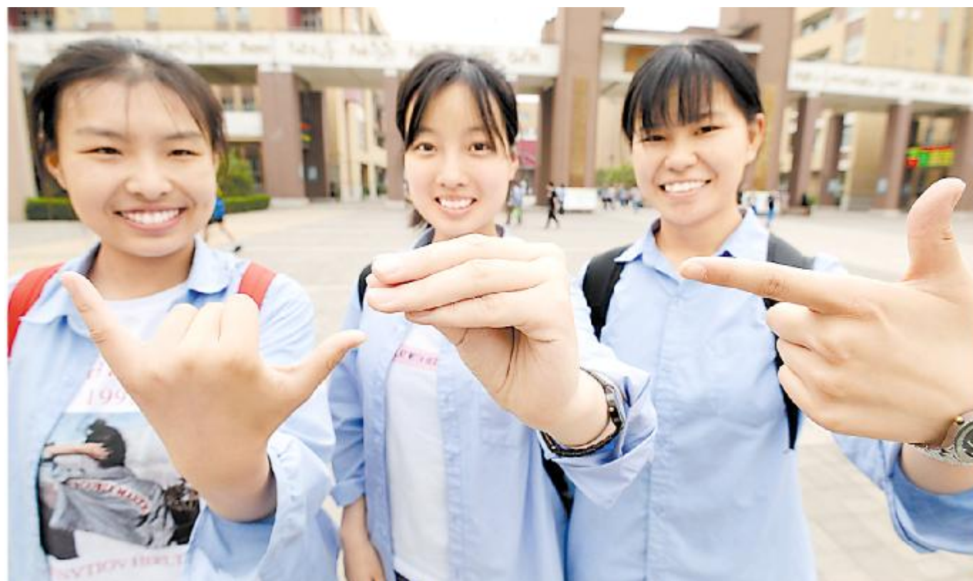
6月7日，在河北省邯郸市第一中学考点，三名考生摆出“678”手势，寓意“录取吧”。

此外，全国卷II卷、上海卷、天津卷、江苏卷分别以“幸存者偏差”“被需要”“器”和“语言”为主题，引导考生联系社会生活中的相关现象，进行开放性的独立思考，充分施展写作才华。