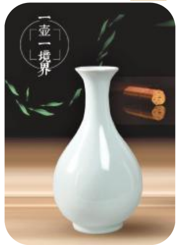
弘室汝瓷作品：玉壶春