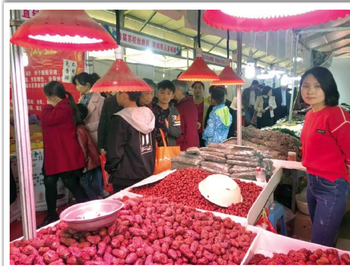
日前,2018“一带一路”服装服饰、名特优食品博览交易会在市互联网+电子商务中心举行,吸引了众多市民前来选购。据悉,此次交易会的时间为4月15日至25日。

阿信教你每月咋领双工资 阿信理财知识推荐 月月息,每月多一份“工资” 中信银行月月息 利息提前月月享 每月给您多一份“工资” 王老伯的拆迁生活:王老伯家有喜事,100万拆迁款刚刚落地,俩人很想做点投资。理财?老年人思想保守,怕亏本;存款?利息跑不赢房价……要如何处置呢? 王老伯:老伴,这么大一笔拆迁款,咱们也得去理理财啊,听说能赚不少利息呢。 王大妈:还是你精明,可是钱全拿去理财的话,平时生活怎么办?咱俩养老金不多,总不能找孩子们要钱花啊。 王老伯:这几天认识了个中信银行的小姑娘,咱去问问她有啥好主意? 王大妈:好嘛。 王老伯:阿信,咱们想用这100万拆迁款赚点利息钱,一来这钱可不能亏,二来想每个月还能取出点钱来花。 阿信:老伯,您可找对人啦!用这100万购买中信银行的“月月息”,这问题都解决啦。 王老伯:“月月息”? 阿信:对呀,“月月息”是中信银行新发行的大额存单产品,保本保息,三年期利率高达3.905%,最大的特点是,拿利息不用等到存款到期,每个月都能拿到利息。您的拆迁款100万存进去,每月能拿3254元,足够日常开销了,加起来一共能拿11万多块的利息呢。 王老伯:不错不错,不过本金什么时候能拿回来。 阿信:月月息是三年期的产品,三年后您就可以把100万本金取出来啦。 王老伯:这个真不错,咱们存进去后每个月花利息过日子就好了,钱放银行也放心。老伴,咱们就办这个“月月息”吧。 中信银行“月月息”,让您的收益不等待; 月月领利息,享受循环复利 理财:生活支出,还月供……样样不耽误 同样是存款:保本保息高收益,提前支取很灵活。 20万,三年,3.75%,每月得利息625元 30万,三年,3.75%,每月得利息937元 50万,三年,3.75%,每月得利息1562元 100万,三年,3.905%,每月得利息3254元 中信银行汝州支行地址: 朝阳路与洗耳路交叉口西南角 理财热线:0375-6096758