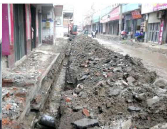
节妇祠街—后火神庙街(洗耳路—老二门街) 道路全长655米,道路现宽5-10.4米不等。改造内容包括:人行道拆除新建、排水井盖及雨水篦子的提升改建、给水管道的拆除新建、道路地基重新夯实,道路照明、台阶及斜坡整治、弱电入地位置预留和道路积水点整治等。