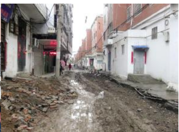
孟拐街(洗耳路—望嵩路) 道路全长349米,道路现宽4-4.5米。改造内容包括:道路地基重新夯实,排水、给水管道的拆除新建,道路照明、台阶及斜坡整治,风景墙设置、弱电入地和燃气位置预留等。