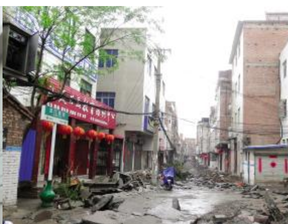
北门里街(广成路—丹阳路) 道路全长591米,道路现宽5-11米。改造内容包括:道路地基重新夯实,排水、给水管道的拆除新建,道路照明、台阶及斜坡整治、风景墙设置、弱电入地、燃气位置预留等。