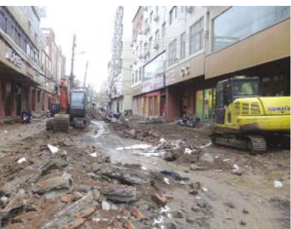
府后街—利民街(望嵩路—城垣路) 道路全长980米,道路现宽5.3-8.7米。改造内容包括:部分路段主路面地基重新夯实,排水、给水管道的拆除新建,排水井盖及雨水篦子提升改建,道路照明、弱电入地、台阶斜坡整治和临时建筑拆除等。