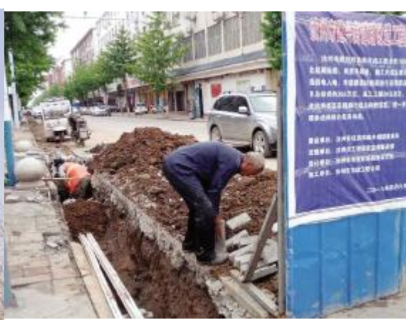
建兴街—营房街(朝阳路—丹阳路) 道路全长1485米,道路现宽20米,适当加宽。主路面及人行道去年已做过整理,行道树较为齐全,本次改造动作不大,只有主路面沥青罩面、弱电入地等。