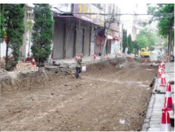
安平街(广成路—丹阳路) 道路全长658米,道路现宽5-6.5米,本次改造适当加宽,主要包括:台阶整治、排水井盖及雨水篦子的提升改建、给水管道的新建、道路地基重新夯实、道路照明、弱电入地、道路积水点整治,适当设置风景墙等。