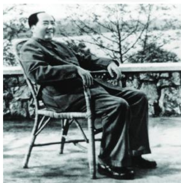
1963年，毛泽东在武昌梅岭三号门口。