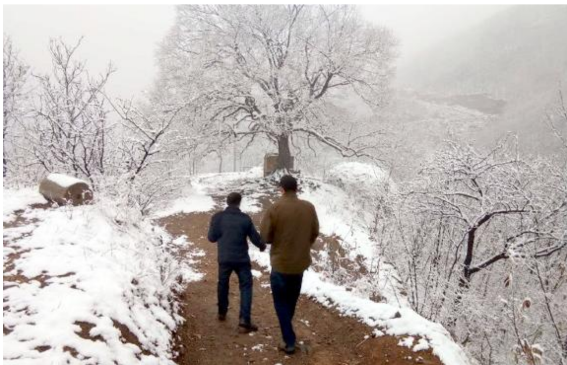
桃花雪覆盖的大峪山村景色。