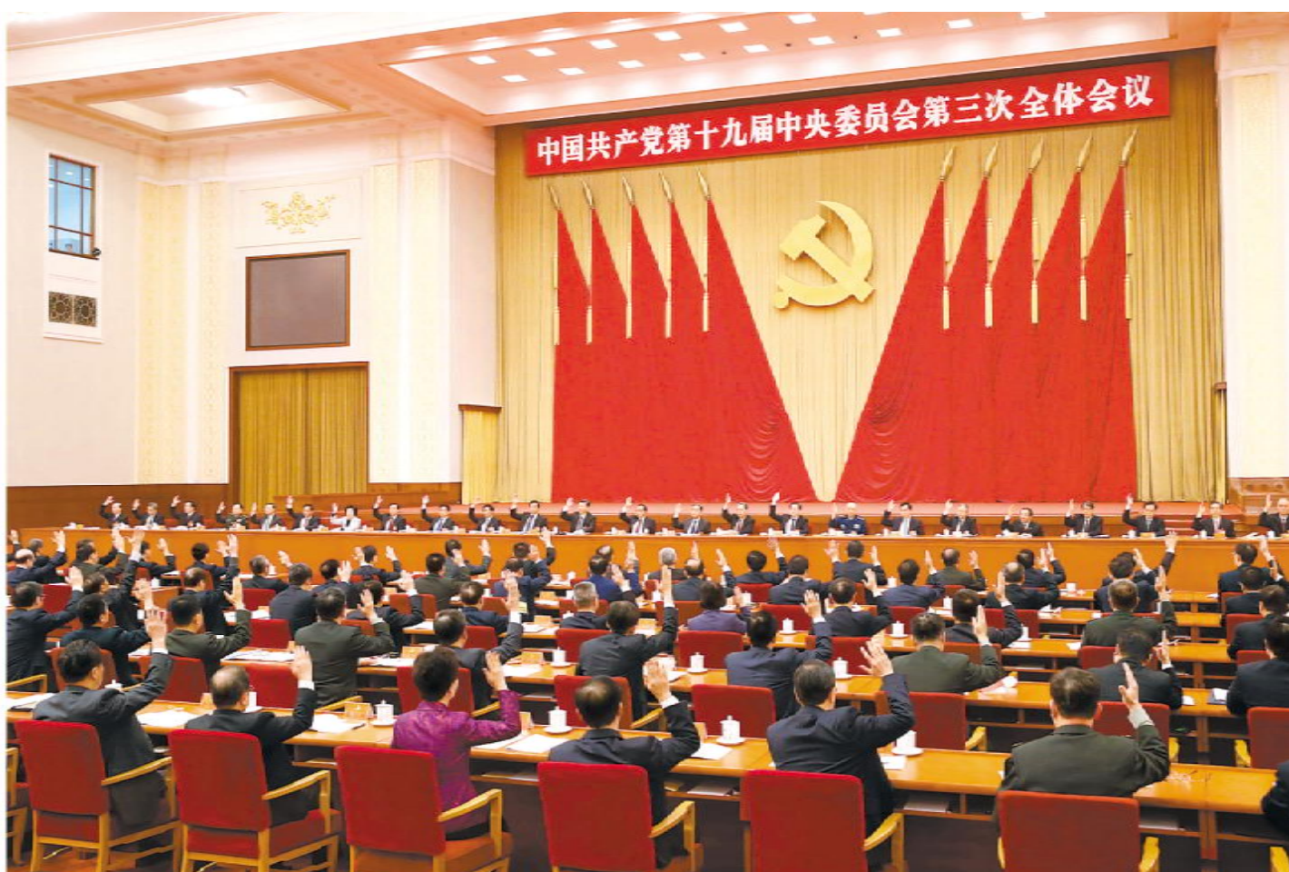
中国共产党第十九届中央委员会第三次全体会议，于2018年2月26日至28日在北京举行。中央政治局主持会议。