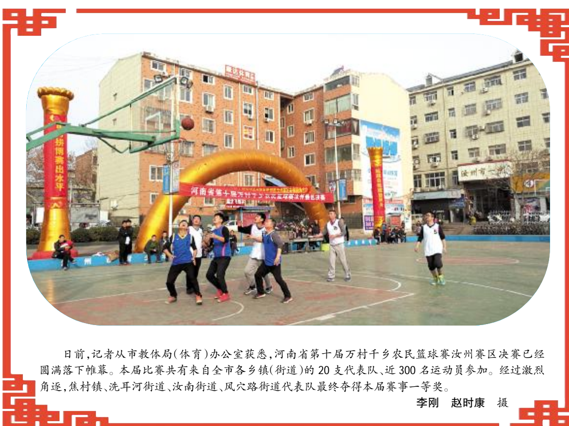
日前，记者从市教体局（体育）办公室获悉，河南省第十届万村千乡农民篮球赛汝州赛区决赛已经圆满落幕。本届比赛共有来自全市各乡镇（街道）的20支代表队、近300名运动员参加。经过激烈角逐，焦村镇、洗耳河街道、汝南街道、凤穴路街道代表队最终夺得本届赛事一等奖。

体育赛事与汝瓷联姻，叱咤风云的赛场上多了汝瓷文化的韵味，使高贵典雅的汝瓷在运动中绽放，成就了体育与汝瓷的佳话。