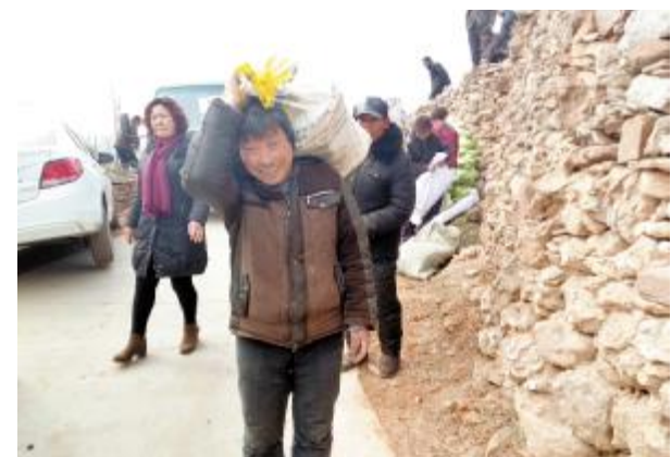
村民领到菜后喜笑颜开

本报讯（记者 于俊鸽）“这菜真好，听说是人家坤元集团自己种的无公害蔬菜，都是送到外地大超市卖的。”“咱们真有口福，能吃到和大城市人一样的菜。”2月9日，在大峪镇下焦村，前来领菜的群众热烈地讨论着，寒冷的山区春意浓浓。