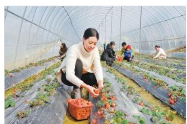
朝中社2月6日提供的照片显示，2月5日，朝鲜艺术团准备乘火车离开平壤，启程赴韩国演出。

据朝鲜《劳动新闻》6日报道，朝鲜艺术团5日乘火车离开平壤前往元山，之后将乘坐“万景峰92”号轮船前往韩国演出。新华社发