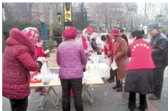
1月24日早上，我市学雷锋志愿者在工人文化宫广场免费为市民提供腊八粥。

此次风穴寺僧人在寺内赠粥时间为上午6:00至6:30，市金博大门口施粥时间为6:45至7:30。