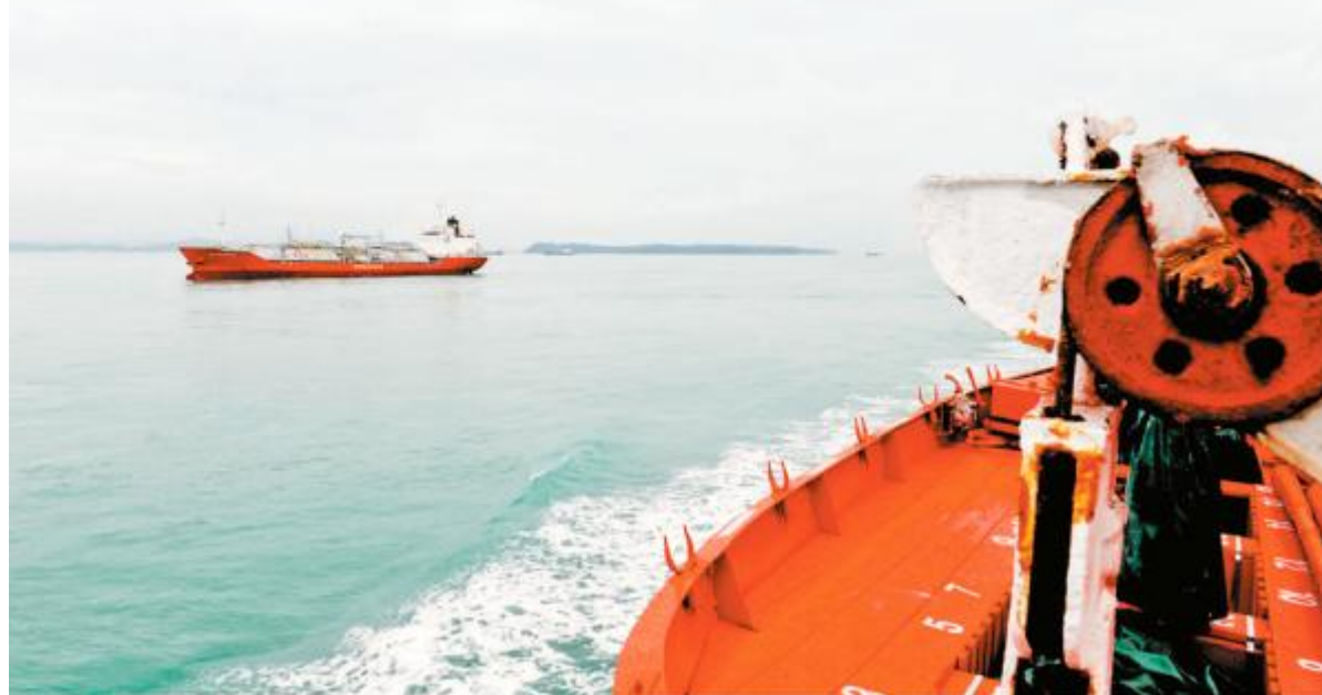
1月4日，正在执行中国和巴基斯坦首次北印度洋联合考察任务的中科院南海海洋研究所“实验3”号科考船，进入马六甲海峡。图为“实验3”号科考船在马六甲海峡航行。