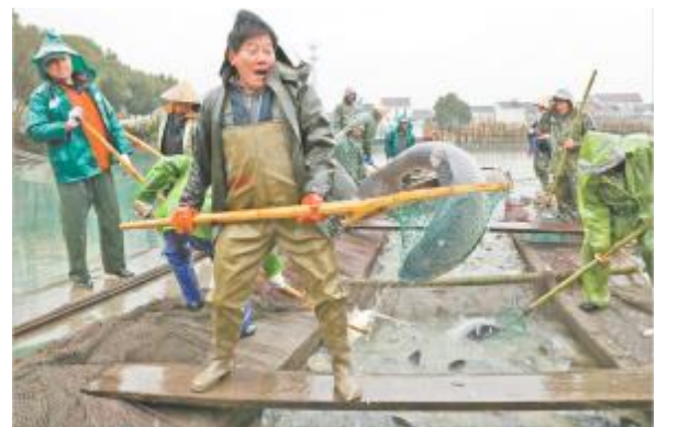
1月4日，浙江湖州市德清县洛舍镇洛舍村的养殖户迎来了一年一度的拉网捕鱼时节，20多名渔民在阵阵吆喝声中拉网收网，呈现出一派“鱼跃人欢”的丰收景象。