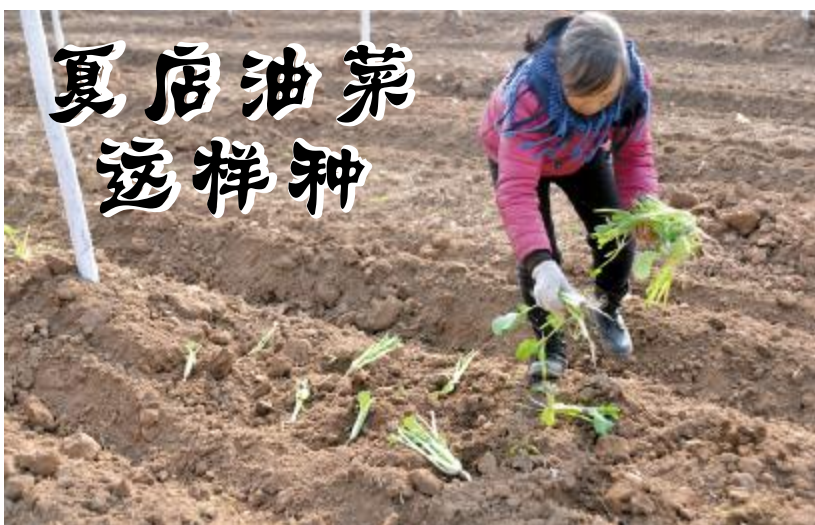
▲见过撒油菜籽的还没见过种油菜苗的。11月28日，记者在夏店镇夏伊线廊道绿化现场看到，农户正在林间种植油菜苗(如上图)。原来，此段廊道绿化升级改造时把土地进行了重新整理，如果再撒油菜籽，会因天气寒冷会影响出苗生长，于是在群众的建议下，种植户移栽油菜苗到这里，既能保证成活率又可提高产量。

书记的话让戴凯华对将来的发展充满了信心，也把戴凯华的心拴在了汝州，他在岳阳小停了几天，又马不停蹄地赶回了汝州，他心里惦记着自己的生态园。进入冬季了，石榴该追肥了，葡萄该修剪打叉了，柴鸡和大雁网上有订购合同，现在正是种植石榴的季节，作为汝州的造林模范，他想一刻不停地去逐梦…… 赵彦锋