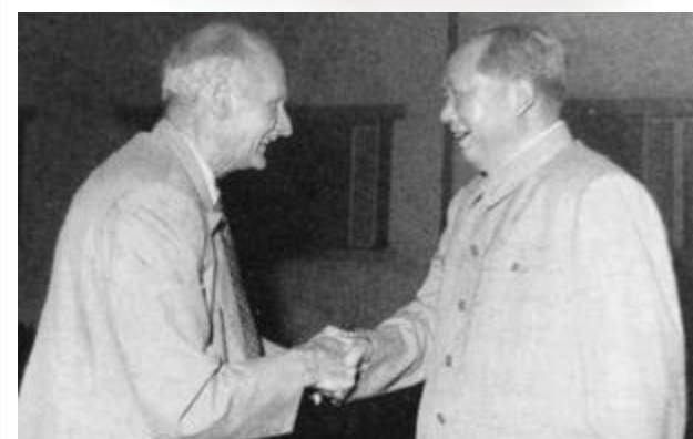
1961年9月23日,毛泽东在武汉东湖宾馆与蒙哥马利握手。

毛泽东说,这位元帅不了解,我们和苏联不同,比斯大林有远见。在延安,我们就注意这个问题,1945年七大就明确了。当时延安是穷山沟,洋人的鼻子嗅不到。1956年开八大,那是大张旗鼓开的,请了民主党派,还请了那么多洋人参加。从头到尾,完全公开,毫无秘密。八大通过新党章,里头有一条:必要时中央委员会设名誉主席一人。为什么要有这一条呀?必要时谁当名誉主席呀?就是嘛。嘛人当名誉主席,谁当主席呀?美国总统出缺,副总统当总统。我们的副主席有五个,排头的是谁呀?刘少奇。我们不叫第一副主席,他实际上就是第一副主席,主持一线工作。刘少奇不是马林科夫。前年,中华人民共和国主席改名换了姓,不再姓毛泽东,换成姓刘少奇,是全国人民代表大会选出来的。以前,两个主席都姓毛,现在,一个姓毛,一个姓刘。过一段时间,两个主席都姓刘。要是马克思不请我,我就当那个名誉主席。谁是我的继承人?何须战略观察!这里头没有铁幕,没有竹幕,只隔一层纸,不是马粪纸,不是玻璃纸,是乡下糊窗子的那种薄薄的纸,一捅就破。我们没有搞“抽样调查”,英国元帅搞了,一搞,发现了问题。中国一些群众也没有捅破这层纸。这位元帅讲了三原则,又对中国友好,就让他来捅。捅破了有好处,让国内国外都能看清楚。什么长生不老药!连秦始皇都找不到。没有那回事,根本不可能。这位元帅是好意,我要告诉他,我随时准备见马克思。没有我,中国照样前进,地球照样转。