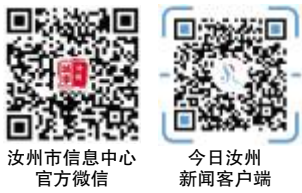
汝州市信息中心官方微信 今日汝州新闻客户端