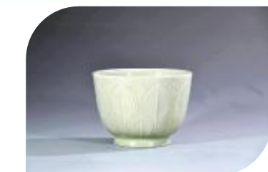
弘宝汝瓷作品 莲瓣纹碗

“青出于蓝而胜于蓝”,正是指学生的成就超越了他的老师,但值得我们注意的是,这种说法在称赞学生成就之余,没有把他的老师推挤于外。对古人来说,学生的成就基于他的老师,有徒弟就有师傅,这既符合中国艺术史的传统,也符合中国的人情文化,是中国的国情。坚守传统文