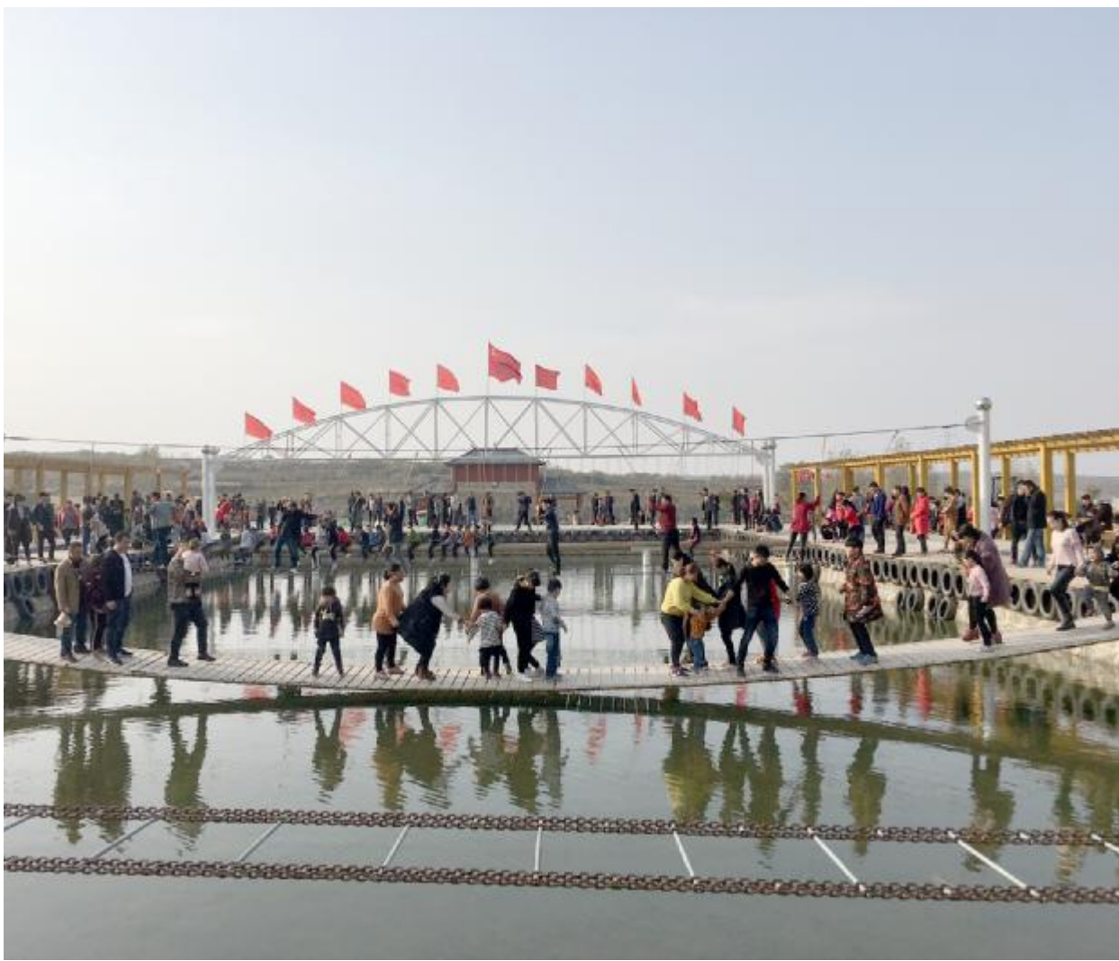
11月5日,天气晴朗,碾平花海吸引了众多游客来此游玩。图为游客们在体验水上项目。宋小亚 摄

据了解,从11月6日起,市中医院、小屯镇卫生院将联合深入小屯镇45个行政村开展家庭医生签约服务宣传和现场签约。市中医院将全力支持小屯镇卫生院做好家庭医生签约服务,总结经验,改进不足,力争将家庭医生签约服务在全市推广,让人人都有家庭医生。