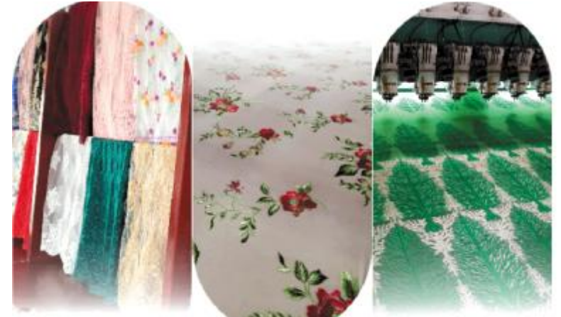
赏心悦目的花色图案