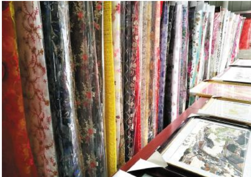
深受东南亚国家人民喜爱的产品