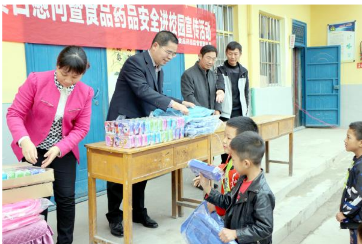
10月12日，市食品药品监督管理局深入大峪镇刘何村小学进行扶贫日慰问并开展了食品药品安全进校园活动，为师生们上了一堂食品药品安全课，并给该校46名学生送去了书包、文具盒、铅笔等学习用品。宋乐义 何乐锋 摄

据悉，今年的两个奖项河南省“最具行业影响力十大女杰”和河南省年度“创新创业十大女杰”，共选出了40位候选人。她们执着地完成了个人价值的自我实现，得到了社会的广泛认同和赞誉，成为中原大地女性的榜样和典范。