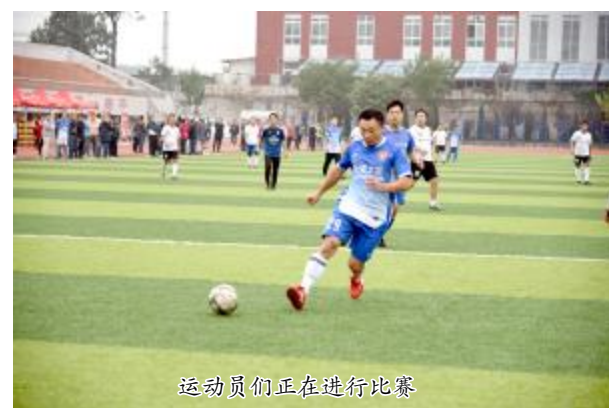
运动员们正在进行比赛

闭幕式上，市委宣传部、市实验中学、市教育局（体育）的相关领导为获奖代表队颁发了奖杯和荣誉证书。