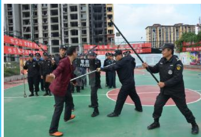
10月13日，市人民医院保卫科30多位保安人员在篮球场进行了一场消防疏散演练，以实际行动捍卫全院人民生命财产安全，全力确保十九大胜利召开。

●10月14日，邓州市新闻中心部分采编人员在主任夏静带领下到我市信息中心考察交流，重点就如何做好十九大新闻宣传报道工作进行交流。会上，大家围绕党委中心如何做好新闻报道工作，以及十九大专题宣传、日常管理、做优报纸、做好新媒体等工作进行探讨，双方表示，今后将继续加强交流学习，共促两地新闻事业发展。宋小亚