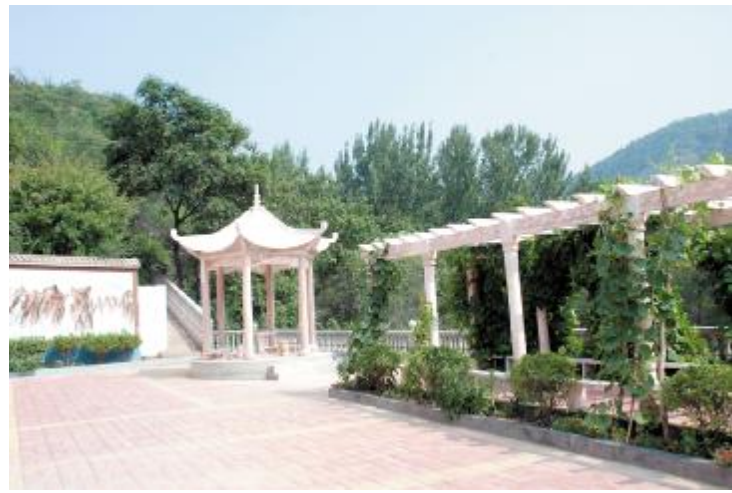
山乡游园别具魅力

回顾五年来取得的成绩和荣誉,是上级党委、政府正确领导、大力支持的结果;是全镇干部群众团结、奋力拼搏的结果;是社会各界鼎力相助、共同努力的结果。今后五年,大峪镇将紧紧围绕“五位一体”总体布局和“四个全面”战略布局,认真落实省第十次党代会和市委七届二次会议提出的目标任务,以新的发展理念为引领,以提高发展质量和效益为中心,着力推动转型发展、绿色发展、创新发展、率先发展,坚定不移推进全面从严治党,全面建成小康社会,努力建设“全省特色旅游小镇”“全省三产改革示范乡镇”。