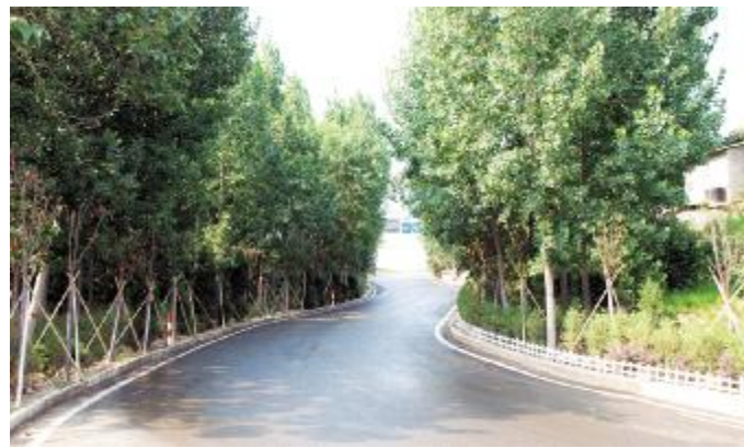
廊道绿化清新养眼