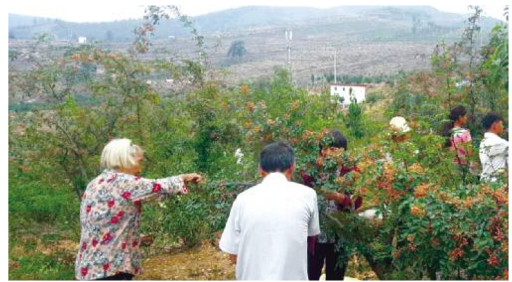
花椒种植助力脱贫