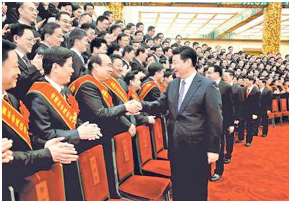
9月19日，全国社会治安综合治理表彰大会在北京人民大会堂举行。会前，习近平、李克强、张高丽等会见与会代表。

人民日报北京9月19日电 全国社会治安综合治理表彰大会19日上午在北京举行。中共中央总书记、国家主席、中央军委主席习近平亲切会见与会代表并发表重要讲话。他强调，发展是硬道理，稳定也是硬道理，抓发展、抓稳定两手都要硬。要坚定不移走中国特色社会主义社会治理之路，善于把党的领导和我国社会主义制度优势转化为社会治理优势，着力推进社会治理系统化、科学化、智能化、法治化，不断完善中国特色社会主义治理体系，确保人民安居乐业、社会安定有序、国家长治久安。