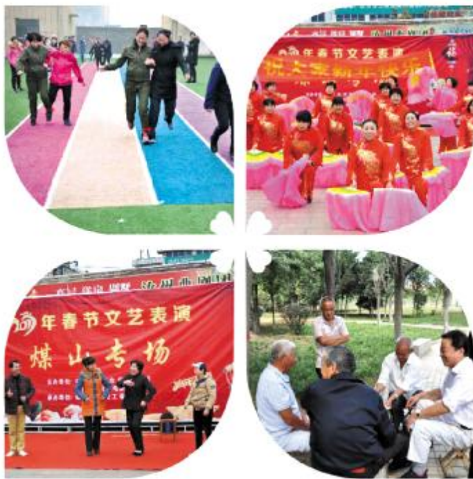
人民群众乐享生活

回顾过去,成绩斐然;展望未来,豪情满怀。站在历史新起点,我们将在市委、市政府的正确领导下,团结带领广大干部群众,奋勇争先,为汝州大发展不断作出新的更大贡献,以优异成绩迎接党的十九大胜利召开。