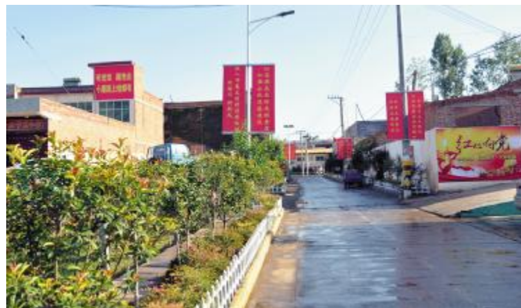
司东村党建宣传街