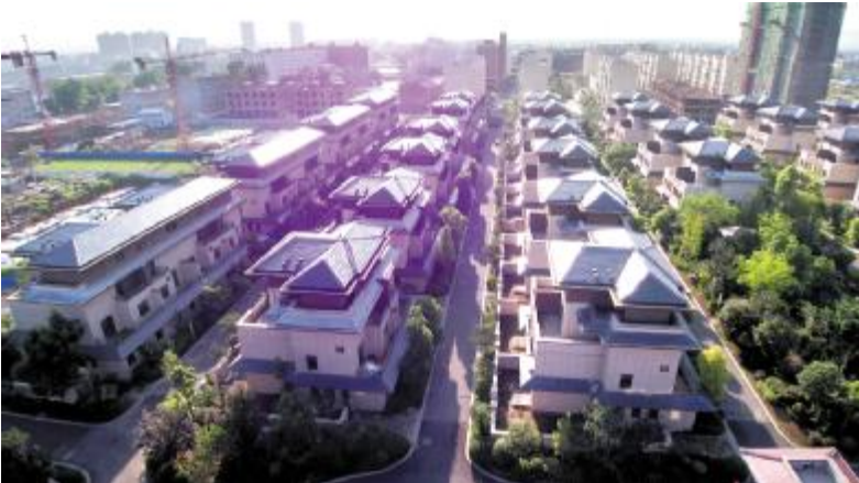
整齐大气的江山一号住宅小区