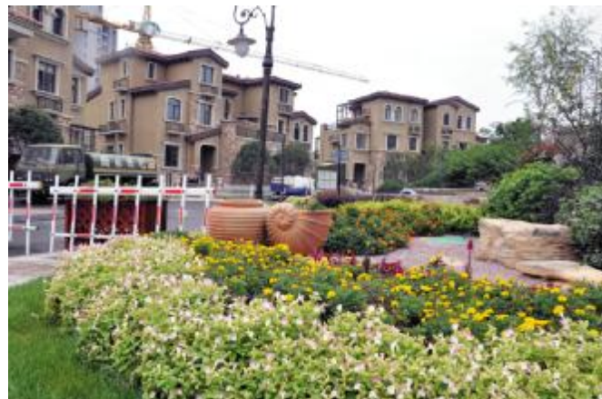
舒适宜居的普罗旺世住宅小区