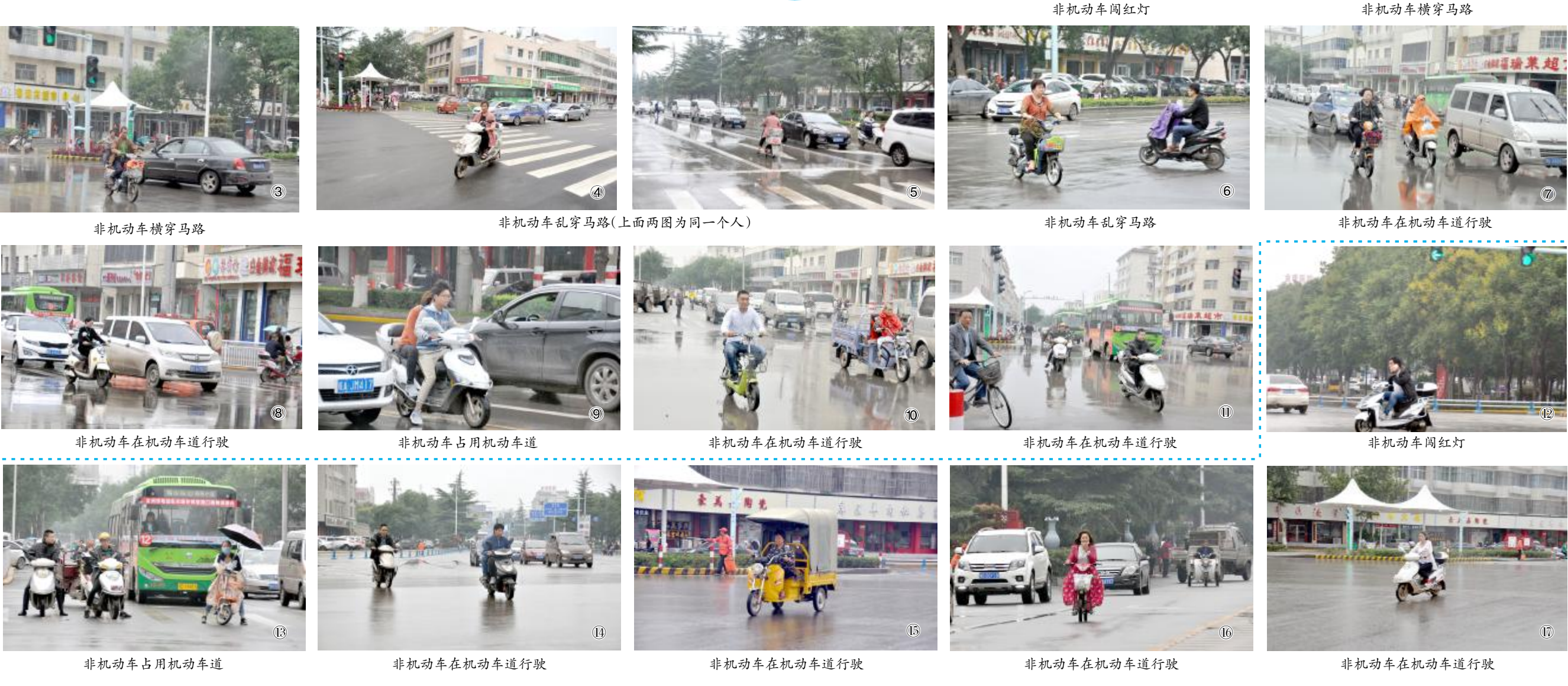
非机动车横穿马路

图①-⑪为广成路与城垣路交叉口不文明行为 图⑫-⑰为广成路与宏翔大道交叉口不文明行为