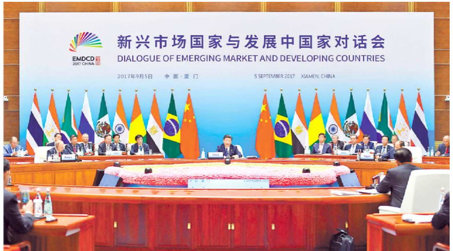
9月5日，国家主席习近平在厦门国际会议中心主持新兴市场国家与发展中国家对话会并发表重要讲话。